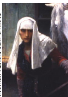
Détail Lady Godiva.

Musée de Picardie 48, rue de la République, 80000 Amiens Tel : 03 22 97 14 00 musees-amiens@amiens-metropole.com www.amiens.fr/musees Relations presse : h.lefevre@amiens-metropole.com