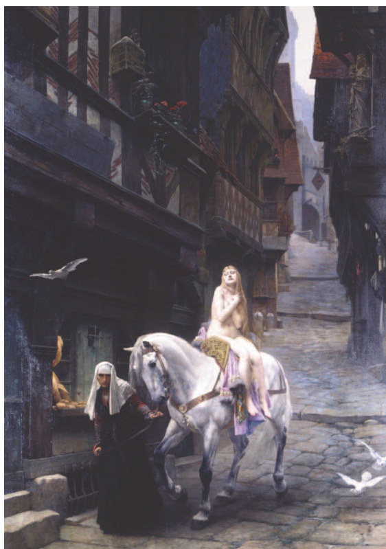
Lady Godiva Cl. Claude Gheerbrant.

Placée à la confluence de plusieurs projets et longtemps dérobée aux regards des visiteurs du Musée de Picardie, Lady Godiva, ne manquera, nous en sommes certains, de vous séduire à votre tour !