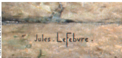
Détail Lady Godiva.

Jules Joseph Lefebvre est né à Tournan en 1836 et meurt à Paris en 1911. Elève de l'Ecole des Beaux-Arts d'Amiens il reçoit une bourse de la ville pour suivre ses études. Il part ensuite étudier à Paris dans l'atelier de Léon Cogniet. Après plusieurs participations aux Salons, il reçoit le premier prix de Rome en 1861 à 25 ans, pour son tableau La mort de Priam . Il part en Italie à la Villa Médicis la même année.