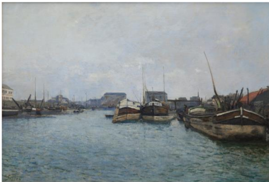
Alfred Sisley (1839-1899), Les Péniches , MNR 206