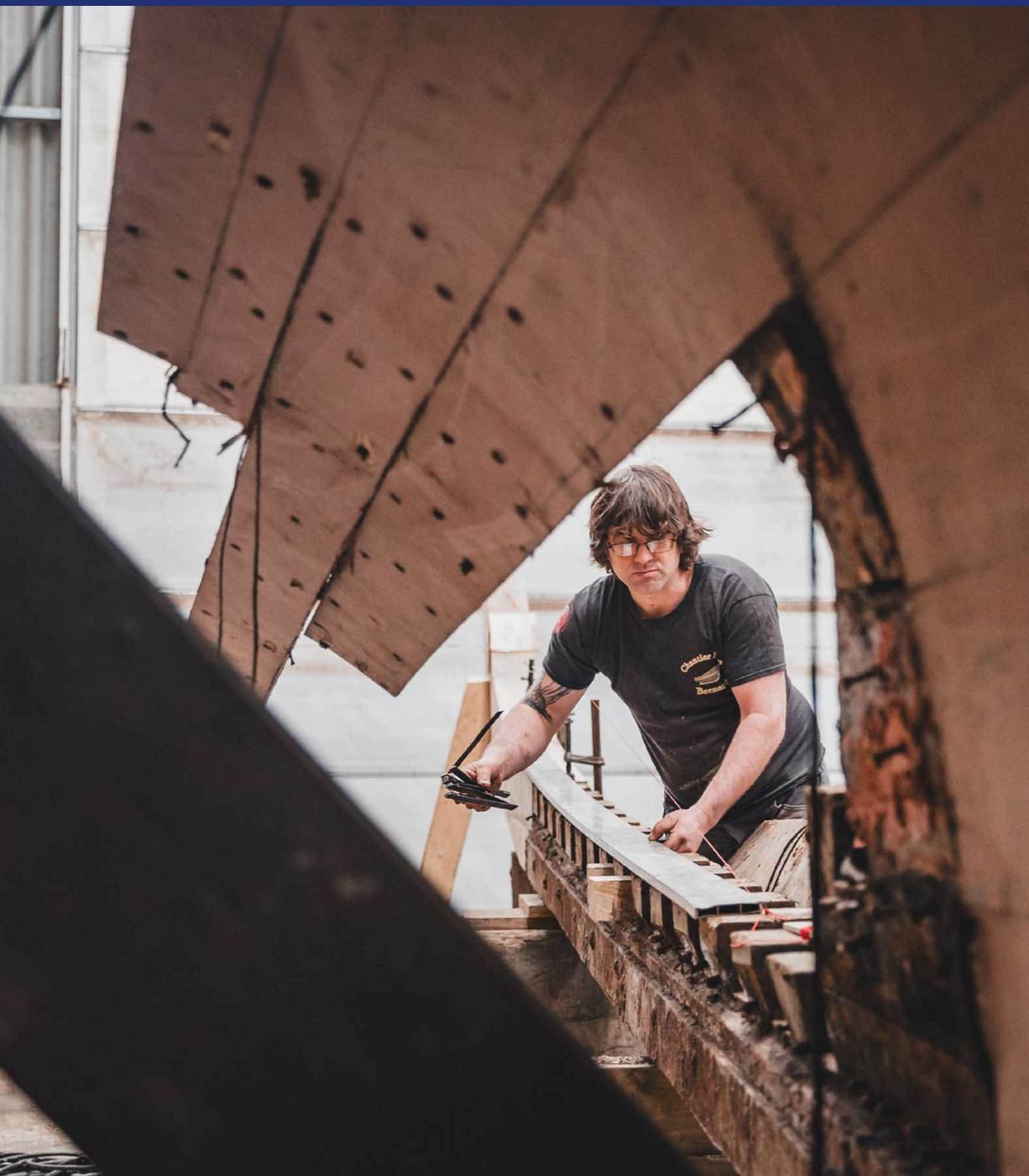
L'art de la charpenterie marine : chantier de restauration du cordier « Les deux amis » - Normandie