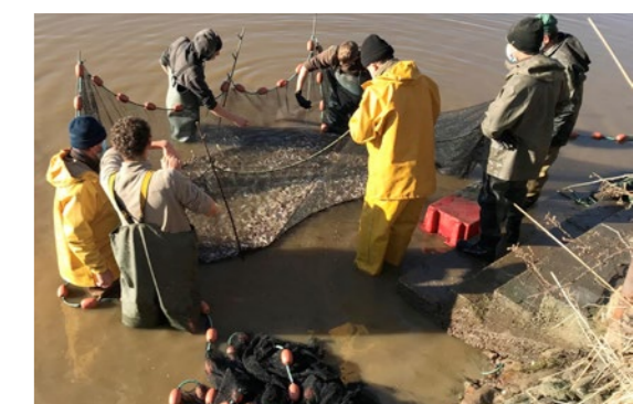
Resserment du filet sur fond de pêche en Brenne - Indre

En Brenne, par exemple, la pisciculture s'appuie sur des pratiques anciennes de gestion des étangs et des ressources aquatiques. Ce savoir-faire, toujours vivant, concilie préservation de la biodiversité et activité économique durable au bénéfice des communautés rurales.