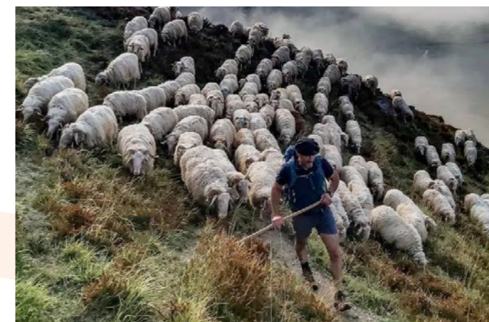
La transhumance

Cet agenda permet d'identifier facilement les manifestations organisées près de chez soi ou dans la région de son choix, avec des informations pratiques (type d'événement, domaine du PCI concerné, date, horaires, public concerné, gratuité, etc.) qui facilitent le passage à l'action et l'envie de participer.