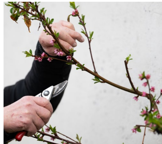
L'art de l'espalier au mur à pêches de Montreuil - Île de France