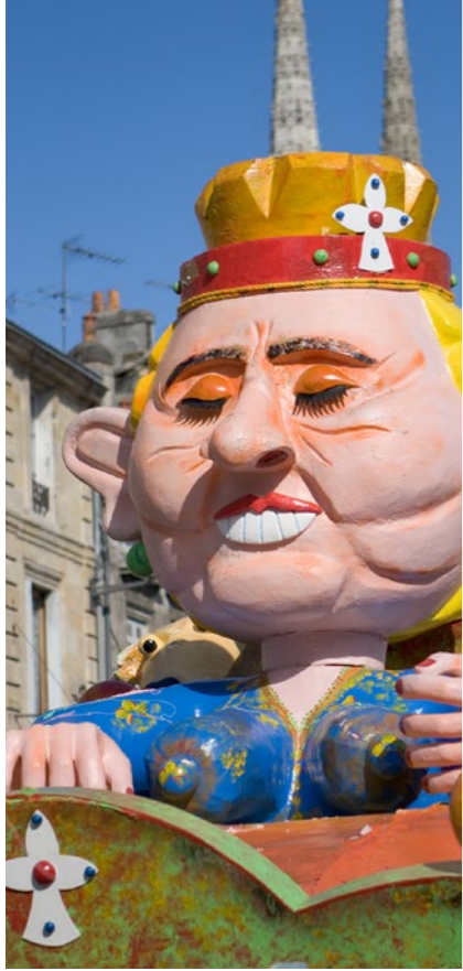
Sa Majesté Allégnor d'Aquitaine au Carnaval des deux rives de Bordeaux - Gironde