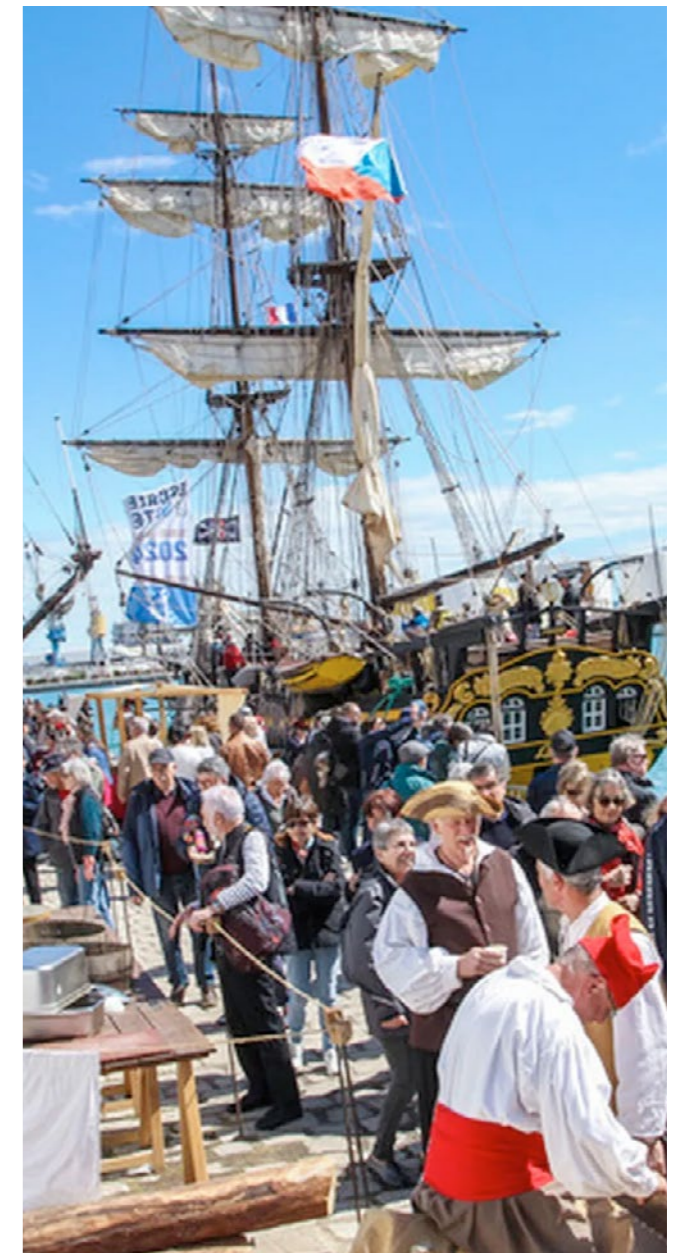
Fête des traditions maritimes Escalade à Sète - Hérault

À destination des adultes - Payant (sur réservation)