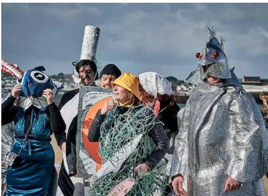
Les sardinières au Carnaval de Gâvres - Morbihan