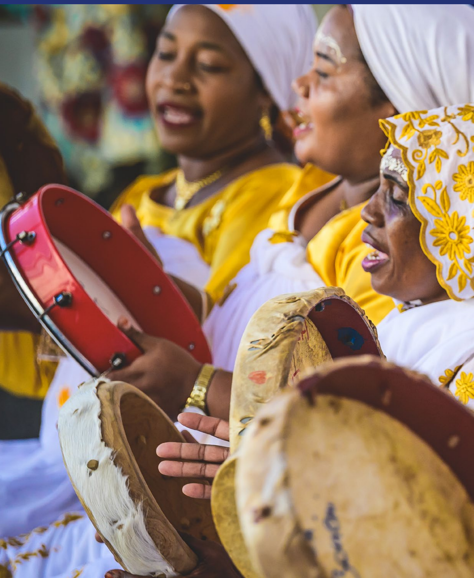
Debaa pendant la 17 e édition du Festival des Arts traditionnels à Mayotte

Parce qu'il reflète les identités dans toute leur diversité, renforce les liens entre les générations et les communautés, le patrimoine culturel immatériel est un puissant levier de cohésion sociale.