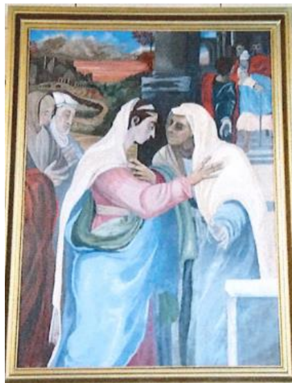
L'œuvre avant et après « restauration » © Cnap

Le récolement permet de constater l'état des œuvres d'art et de demander aux dépositaires de procéder à une éventuelle restauration. Celle-ci doit être impérativement menée par des restaurateurs agréés par les musées de France, en étroite collaboration avec les conservateurs d'antiquités et d'objets d'art rattachés à chaque direction régionale des affaires culturelles. A Hirlé, un tableau de Lazare Meyer, La Visitation (FNAC FH 868-256), a ainsi été restauré sans autorisation par un restaurateur non agréé. Suite au récolement du tableau, le Cnap a immédiatement demandé à la mairie de faire examiner le tableau par un restaurateur officiel afin de savoir si l'intervention est réversible et si le tableau peut être sauvé. Il s'est appuyé sur le conservateur d'antiquités et d'objets d'art d'Ille-et-Vilaine, qui assure le lien avec la mairie, et l'a conseillé dans le choix d'un conservateur-restaurateur agréé pour cette étude.