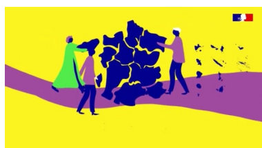
La politique linguistique bit.ly/video-cadrelegal