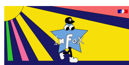
L'histoire du terme « infox » bit.ly/video-infox