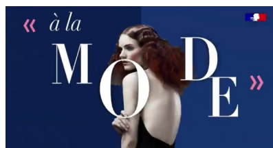
Les mots de la mode bit.ly/video-motsdelamode