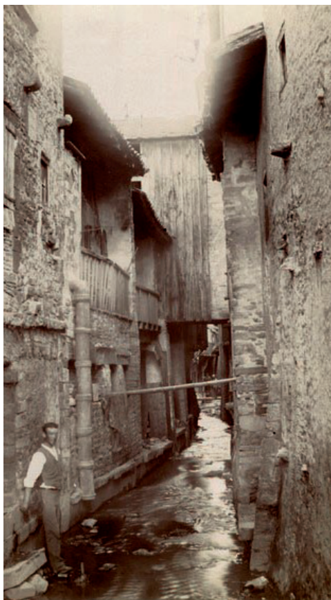
Bief Potet avant 1912

Finalement, en 1912, le bief est recouvert d'un dallage pour devenir souterrain. Aujourd'hui, très peu d'indices rappellent la présence du bief.