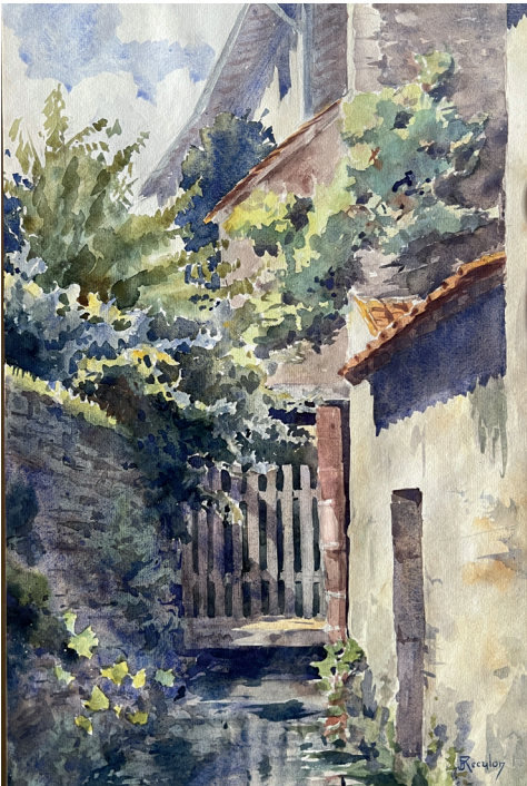
Bief du Potet, près du moulin Cornillat (vers 1910, par Reculon) © Ville de Tournus

Ce puits porte le nom d'un célèbre tableau de J.-B. Greuze : La Cruche cassée . Situé à un croisement de routes importantes, il possède la particularité d'avoir une double entrée : une ouverture côté rue qui servait aux habitants à s'approvisionner en eau et une autre privée, côté jardin, offrant au propriétaire de la maison l'accès à l'eau pour son usage domestique. La légende veut qu'un soir J.-B. Greuze se promenant dans les rues de Tournus aperçut, sur le rebord du puits, un couple de jeunes tourtereaux se laissant aller au plaisir de la vie... Son tableau, conservé au musée de Louvre, représente ainsi une jeune femme, tenant une cruche cassée, allégorie de la perte de l'innocence.