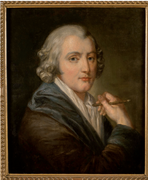
Autoportrait de J.-B. Greuze (vers 1755), conservé au musée Greuze de Tournus