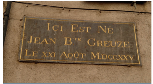
Plaque commémorative au n°5 rue Greuze

Formé à Lyon entre 1745 et 1750, Greuze rejoint ensuite Paris.