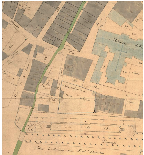
Cadastre de 1811

Plusieurs moulins, à tan ou à plâtre, étaient installés le long du bief Potet, dans le centre de Tournus. Le moulin Cornillat, du nom d'un de ses anciens propriétaires, broyait ainsi l'écorce de chêne ou de châtaignier pour produire le tan, utilisé pour le tannage des peaux. Il appartenait au XVIII e siècle à l'Hôtel-Dieu voisin. Dans les années 1970, il est décidé d'ouvrir largement la rue de l'Hôpital, vers la route départementale, afin de revitaliser le centre-ville en facilitant son accès. Des immeubles sont détruits, la rue Cornillat, petite ruelle sombre, disparaît en 1980. Le quartier se réorganise complètement, permettant aux habitants de profiter d'une ouverture du regard, en direction de l'Hôtel-Dieu.