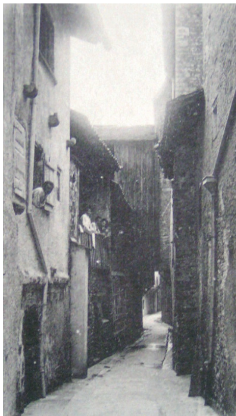
Bief Potet, après sa couverture en 1912