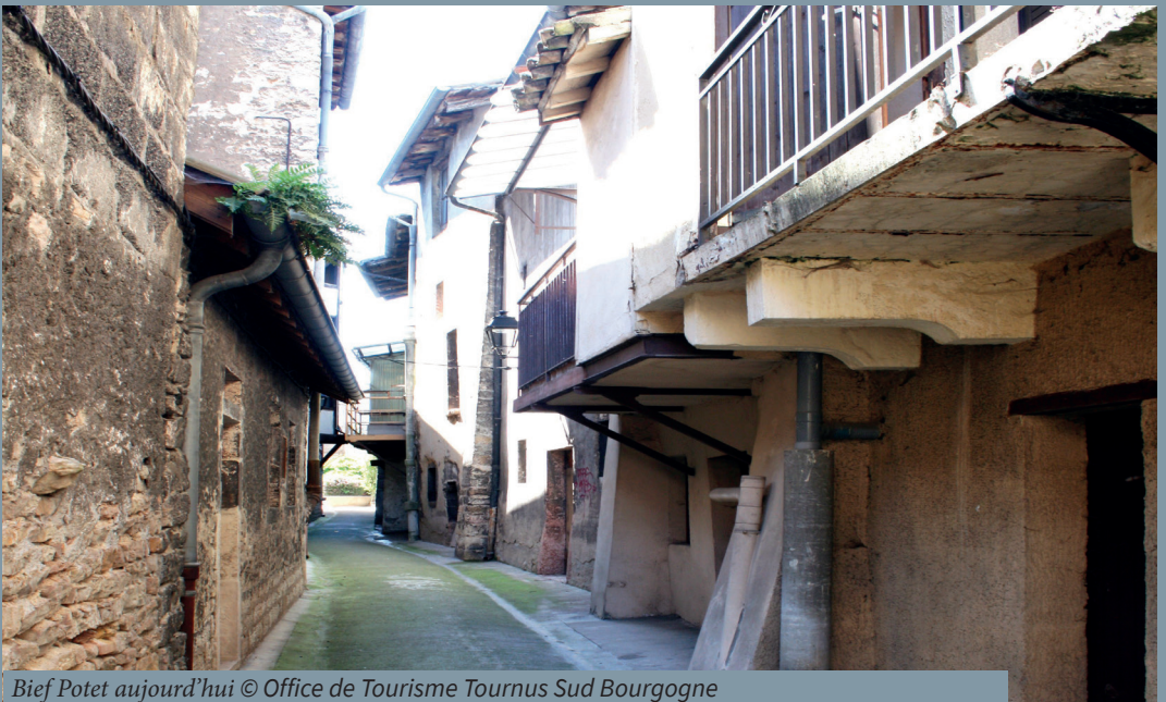
Bief Potet aujourd'hui