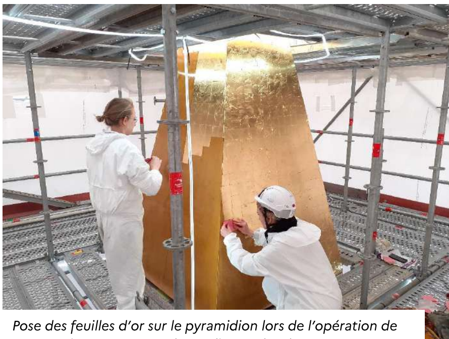
Pose des feuilles d'or sur le pyramidion lors de l'opération de restauration en 2022 par les ateliers Gohard.

Pendant les opérations de restauration, le pyramidion en bronze sur une structure en acier recouvert d'or, posé en 1998 a été redoré à la feuille d'or par l'entreprise Gohard, lui rendant son éclat d'origine, et à l'obélisque celui de son image de rayon de soleil pétrifié, gloire à Ramsès II.