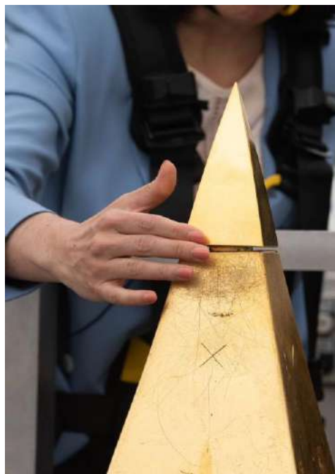
Installation de la pointe du pyramidion.