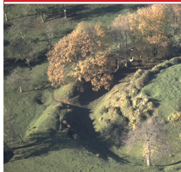
Motte de Fressenneville (Somme)