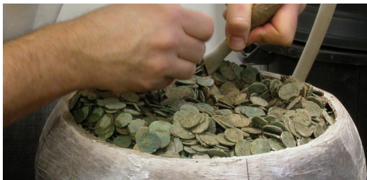
Fouille en laboratoire d'une cruche remplie de monnaies du III e s. ap. J.-C. (Pannecé, Loire-Atlantique)

Les archéologues professionnels collaborent avec des spécialistes de nombreuses disciplines pour inventorier, étudier puis replacer dans un contexte historique les traces parfois ténues mais toujours significatives de l'histoire des hommes. La publication scientifique et la valorisation des résultats auprès du grand public sont les objectifs majeurs de la profession car toute intervention sur un site archéologique implique la destruction, par l'étude raisonnée, des vestiges de nature diverse enfouis dans le sol.