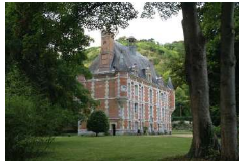
Château de Canteloup - Amfreville-sous-les-monts

Le taux d'aide de l'État pour les travaux est modulé en fonction de critères précis à partir d'un taux de base de 20 %.