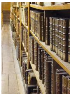
Fonds Anciens d'Avranches ©ville d'Avranches