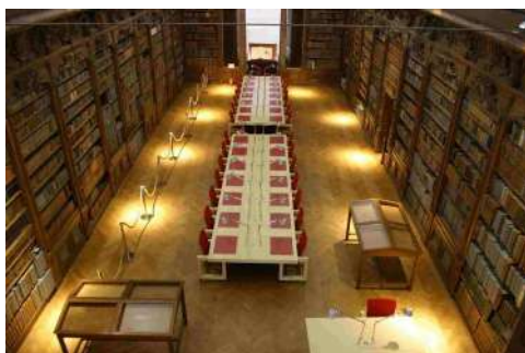
Médiathèque d'Alençon ©médiathèque de la communauté urbaine d'Alençon