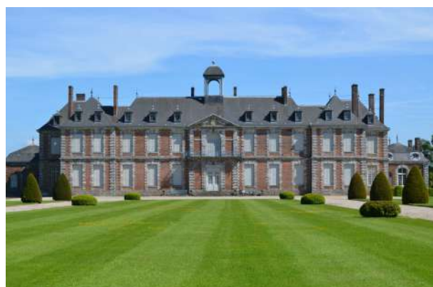
Château de Galleville – Doudeville

Les demandes faites à la DRAC ne sont pas transmises aux autres partenaires, il appartient au propriétaire de saisir chaque partenaire financier, tels que les conseils départementaux et le conseil régional et de leur transmettre les dossiers de demandes de subvention complets. La Fondation du Patrimoine peut également accompagner certains projets.