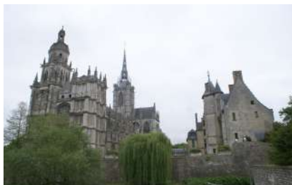
Cathédrale d'Evreux © DRAC de Normandie

Une forte demande sociale est constatée, liée au désir d'appropriation du patrimoine, au souhait légitime d'information, et à la bonne compréhension de l'emploi des dépenses publiques.