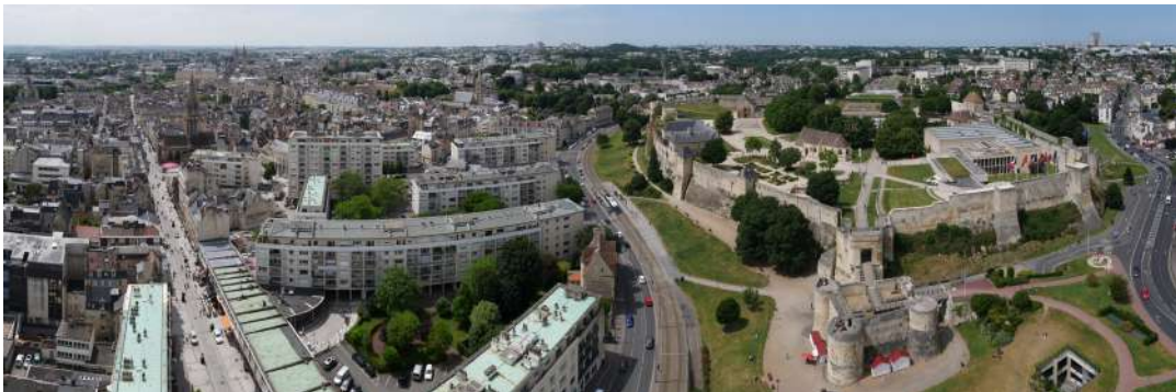
Ville de Caen

Le montant de travaux subventionnable est plafonné à 100 000 € H.T.