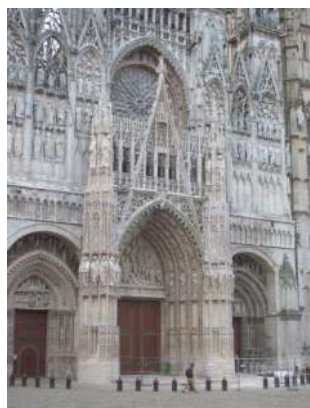
Cathédrale de Rouen