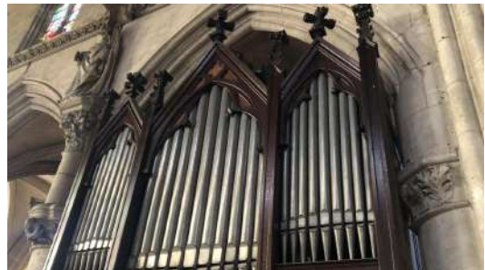
Orgue de l'église Saint-Croix de Bernay

Le seuil financier pour les opérations de restauration est de 5 000 € H.T.