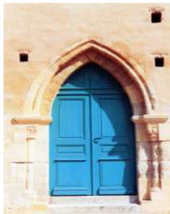
Eglise de Grangues

Pour bénéficier d'une aide de l'Etat les diagnostics ne devront pas avoir débuté et ne bénéficieront pas d'une aide a posteriori. Article 9 du décret n° 2018-514 du 25 juin 2018 : « La dépense subventionnable ne peut intégrer les dépenses effectuées antérieurement à la date de réception de la demande de subvention, sauf dans le cas mentionné au III de l'article 5. »