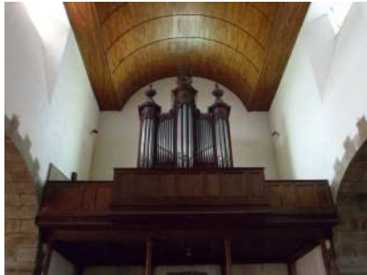
Orgue de l'église Saint-Pierre d'Hambye

Aucun seuil n'est requis pour les opérations d'entretien nécessaire à la bonne conservation de l'instrument.