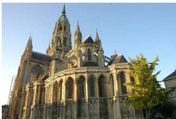
Cathédrale de Bayeux