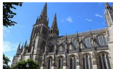
Cathédrale de Sées

Selon l'importance et la durée des travaux, la DRAC préconise une communication adaptée et pédagogique auprès des habitants du territoire concerné, à propos de la nature des travaux entrepris, des parties prenantes et de l'intérêt patrimonial du bâtiment en question.