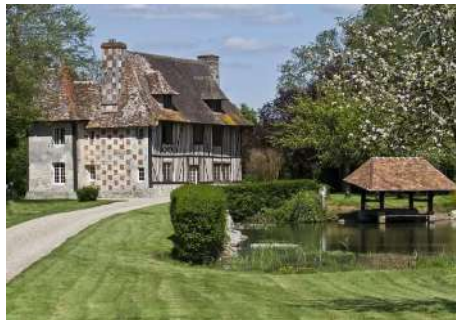
Ferme-manoir-du-champ-versant - Bonnebosq