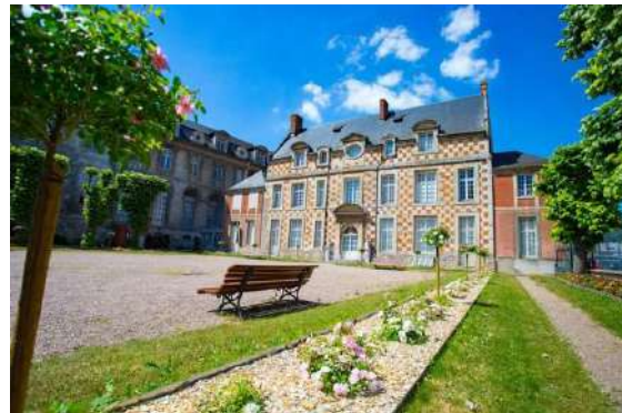
Musée de Bernay