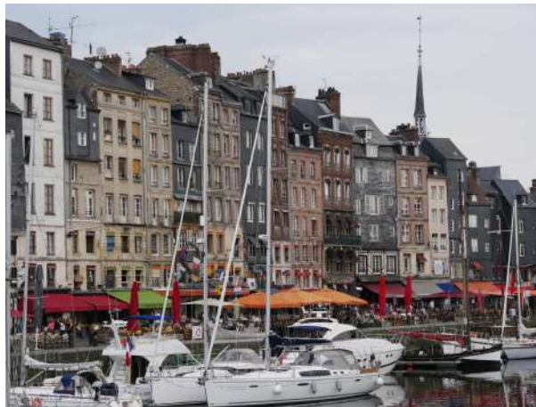
Ville d'Honfleur