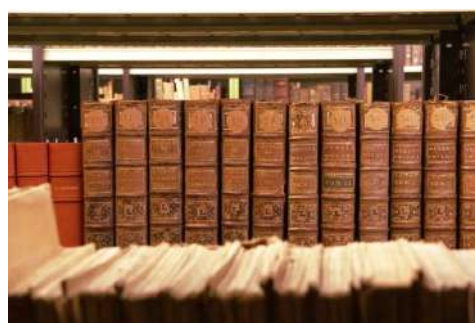
Médiathèque de Vernon