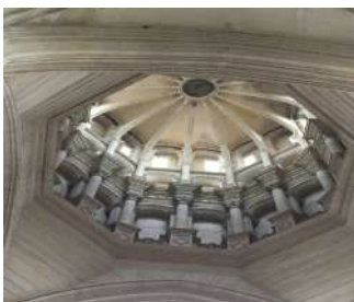
Cathédrale de Coutances