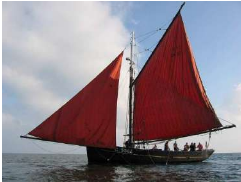
la Grandcopaise

Un taux maximal de 40 % pourra être appliqué aux opérations d'entretien et de restauration en fonction de la nature et de l'ampleur du projet, sous réserve de la disponibilité des crédits et de la programmation.