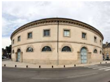
Halle au blé - Alençon