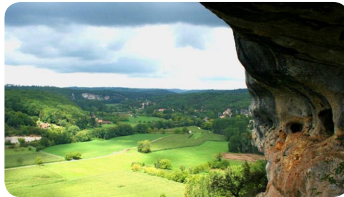
Les Eyzies-de-Tayac

Cette unité historique recouvre une grande diversité de paysages : au nord-est le Périgord Vert situé sur les dernières hauteurs granitiques du Limousin, au nord-ouest le Ribéracois prolongeant les terres calcaires de Charente, à l'ouest la Double et le Landais couverts de forêts, au sud-ouest le Bergeracois et ses vignes en transition vers les pays girondins et agenais et, dans le quart sud-est le Sarladais, ou «Périgord noir» des falaises, des rivières, des châteaux forts et de la Préhistoire.