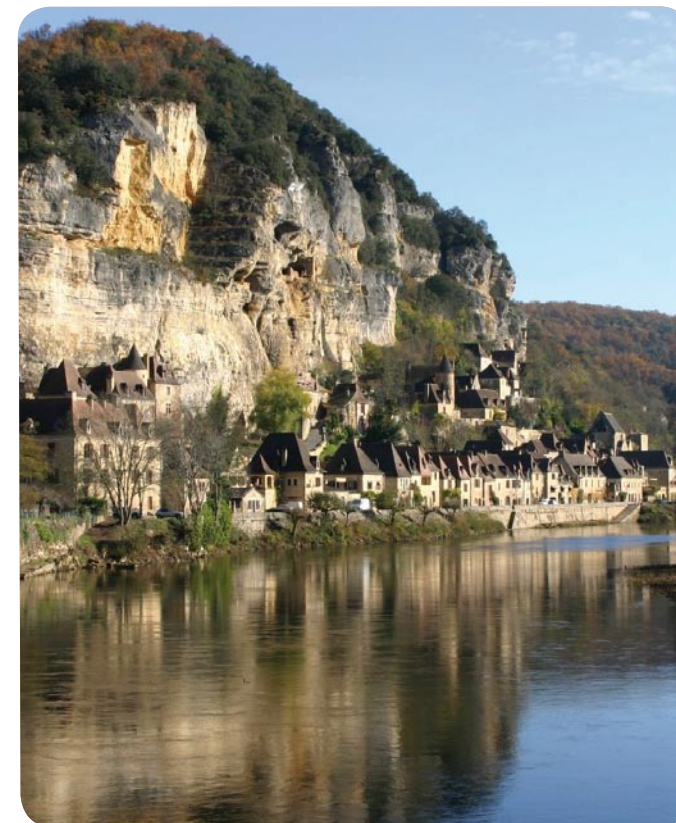
La Roque Gageac - Bourg

UDAP | Unité départementale de l'architecture et du patrimoine DORDOGNE