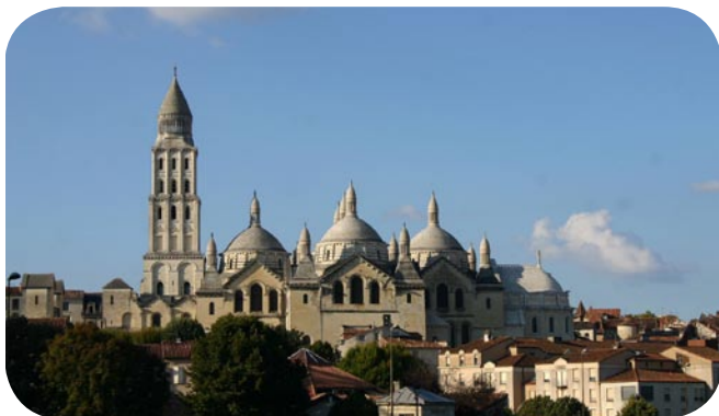
Cathédrale Saint-Front - Périgueux

05.53.06.20.60 udap.dordogne@culture.gouv.fr