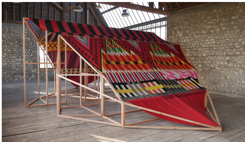
Santiago Borja, Totemic Sampler , 2018. Œuvre produite et réalisée à l'Atelier Calder, Saché.

l'équipement et révéler son patrimoine exceptionnel. Votée en décembre 2019 par le Conseil Municipal, l'opération de réhabilitation vise à redonner au bâtiment d'André Hermant l'aura qu'il mérite et de placer le QUADRILATÈRE sur la carte des architectures remarquables du XX e siècle.