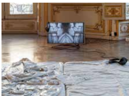
Mélanie Matranga & Nil Yalter