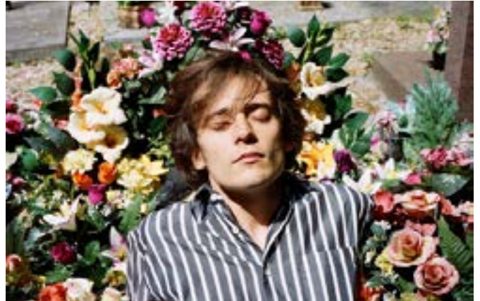
Dani Terreur © Severin