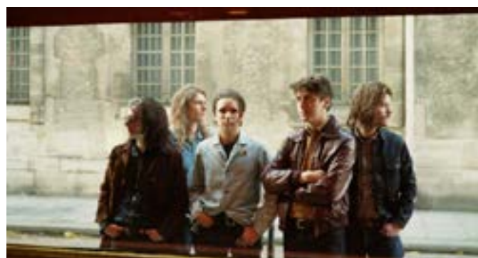
Theo Lawrence and the Hearts

Programme centré sur les œuvres du pianiste Thelonious Monk, autour d'arrangements inédits écrits par Alain Soler