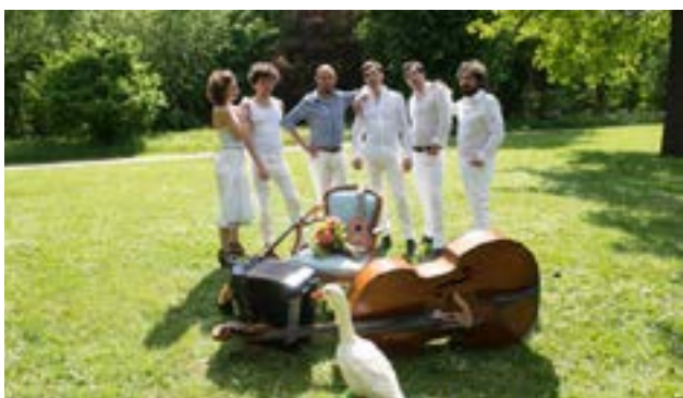
Le Bal des Martine