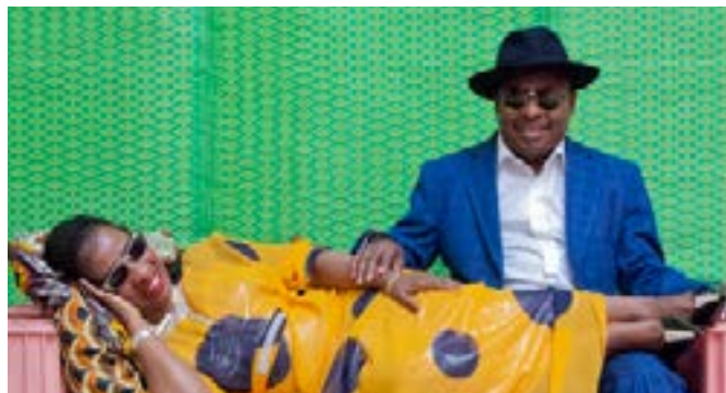
Amadou et Mariam

Automne 2018, Gentilly, France : la potion magique des 5 vingtenaires de Theo Lawrence & The Hearts est prête. Animée par un condensé de 80 ans d'histoire de la soul, du blues, du rock'n'roll, de la folk, du hip hop, de la country music, la platine vinyle tourne à plein régime. Le voyage dans le temps proposé par ces jeunes gens modernes séduit : après 2 singles très remarquables, le groupe enchaîne les dates partout dans le monde et sort un premier album, Homemade Lemonade .