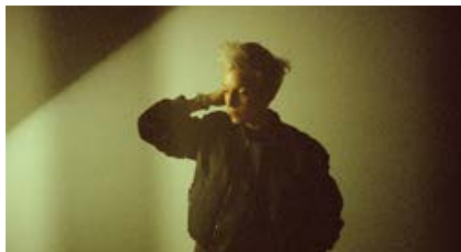
Jeanne Added

Originaires de Nîmes, les quatre membres de VSO, accompagnés du youtubeur Maxenss, cherchent à montrer que la musique urbaine n'est pas uniquement sociale, mais surtout générationnelle. À la fois hâbleur et pétri de doutes, ce rap des classes moyennes, d'une jeunesse « normale », décrit une réalité largement partagée dans des refrains accrocheurs, solaires, aux mélodies galbées.