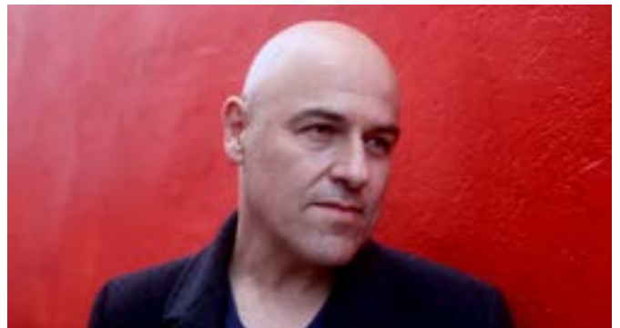
Dominique A © Vincent Delerm

Dans son premier album sorti en mars 2018, Palatine raconte ces entrelacs de destins qui nous emmènent ici ou ailleurs, avec tel ou tel autre, à nous aimer, à nous haïr. Le groupe, constitué de quatre membres, cultive des influences Folk / Rock dont se dégagent une poésie noire, un (dés)espoir lumineux, induits par une écriture au cordeau et des arrangements crépusculaires.