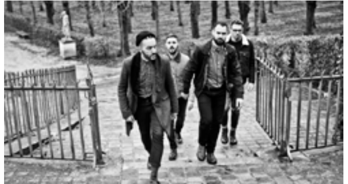
Palatine © Amandine Lauriol