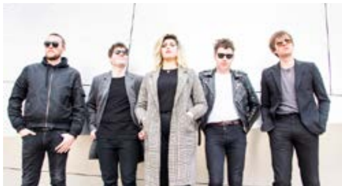
Metro Verlainne