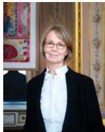
Françoise Nyssen

Pour la 37ème année consécutive, la journée la plus longue de l'année sera aussi la plus musicale : une fois encore, la Fête de la Musique inaugure l'été.