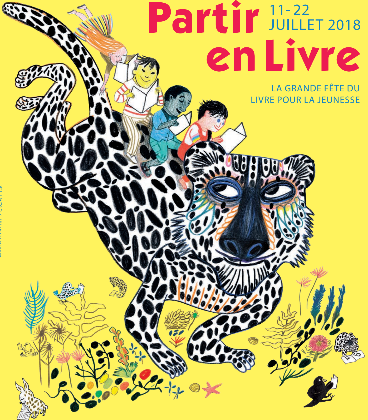
ILLUSTRATION KITTY CROWTHER

LA GRANDE FÊTE DU LIVRE POUR LA JEUNESSE