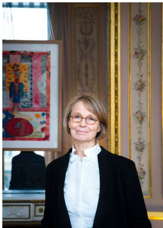
Françoise Nyssen Ministre de la Culture