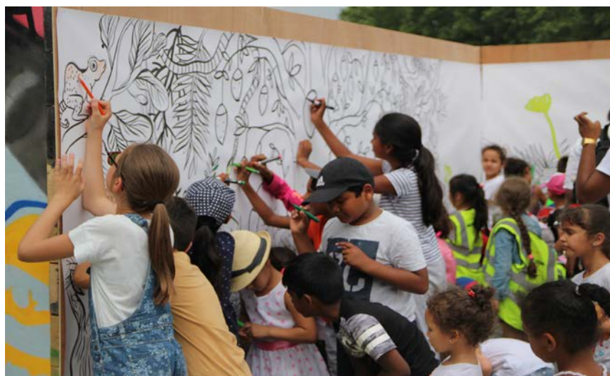
1. Partir en livre 2017, parc littéraire de Pantin

* Des centaines d'événements organisés par les partenaires officiels de Partir en livre.