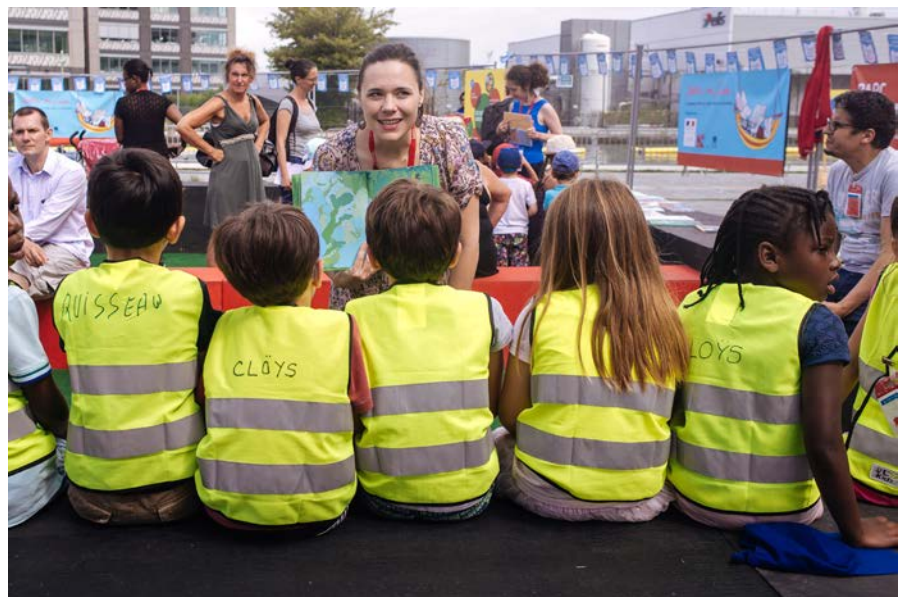
1. Parc littéraire de Pantin 2017

Directrice du Salon du livre et de la presse jeunesse en Seine-Saint-Denis.