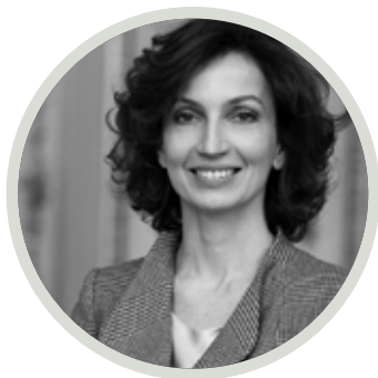
Audrey Azoulay, ministre de la Culture et de la Communication

Au sein d'une société où les tensions sont attisées, dans un contexte marqué par les incertitudes, je veux réaffirmer la place de la culture. Elle est une impérieuse nécessité pour notre pays, n'en déplaise aux esprits démagogiques et réactionnaires qui n'y voient que l'accessoire. La culture est à mes yeux un fondement du pacte républicain, elle en incarne parfaitement les valeurs. Elle dit ce qu'est notre projet de société humaniste.