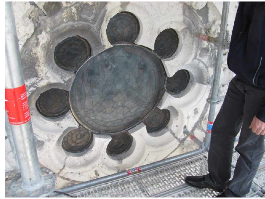
Doublage de la verrière (détail)