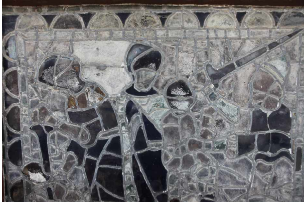
Avant restauration