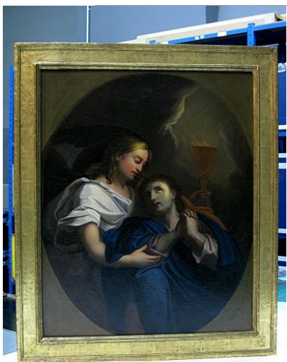
1-Le Christ au jardin des Oliviers (huile sur toile) le jour de sa restitution, le 22 mars 2010.

S'il faut naturellement se réjouir du retour de ces objets, la vigilance des services de l'État ne doit pas pour autant se relâcher face à une menace hélas toujours présente. Le vol, en avril 2010, de la copie du portrait du cardinal de Coislin (10) dans la même cathédrale d'Orléans, l'a douloureusement rappelé ; ajoutons cependant que cette copie de médiocre qualité avait été substituée il y a quelques années à l'original attribué à Hyacinthe Rigaud, précisément par crainte d'un vol. Aussi la sécurisation des œuvres d'art de toute nature que conservent les cathédrales de la région demeure-t-elle une préoccupation constante de la DRAC (CRMH) du Centre.