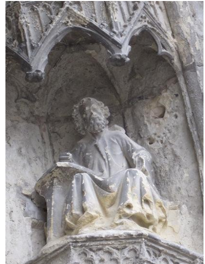
8-Le saint Matthieu remis en place le 17 juin 2011 par les soins de l'atelier Le Sciapode (Compiègne).