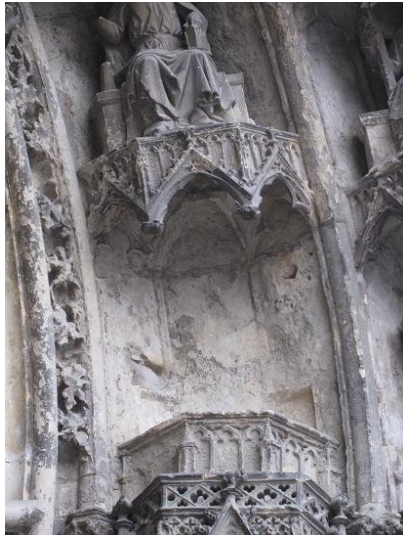
6-Détail de l'emplacement du saint Matthieu.