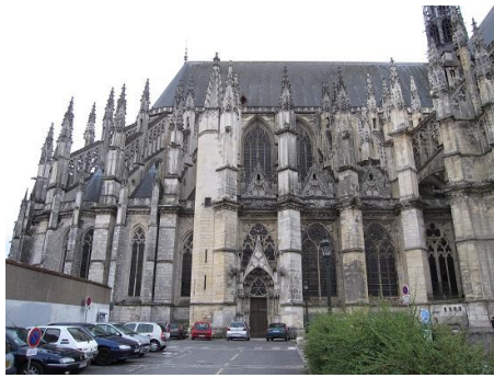
3-L'extérieur du collatéral nord du chœur en septembre 2010 avec, au centre, le portail dit de Monseigneur.