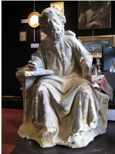
7-Le saint Matthieu lors de sa redécouverte en octobre 2010.