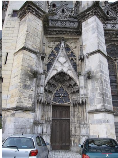
4-Vue rapprochée du portail dit de Monseigneur.