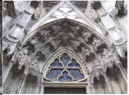
5-L'ensemble des vousses. En bas à droite : emplacement du saint Matthieu volé en mars 1998.