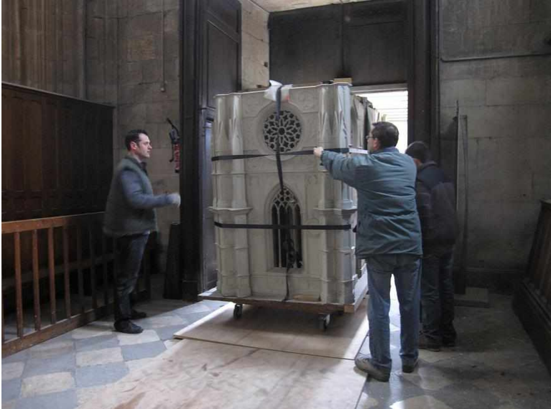
La maquette en cours de restauration aux Ateliers de la Chapelle (Le Longeron, Maine-et-Loire).1/3