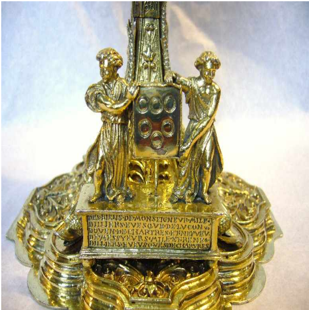
Cliché O. Tavano