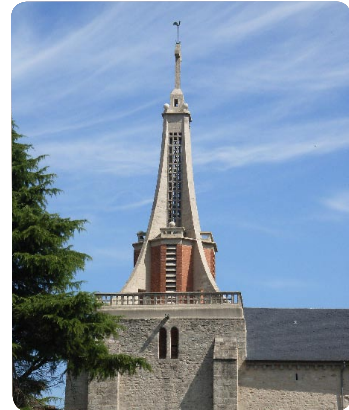
Clocher de l'église de Saint-Vaury – Frères Perret architectes

UDAP | Unité départementale de l'architecture et du patrimoine CREUSE