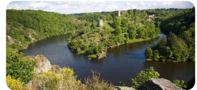
Vallée des peintres Crozant

La tapisserie naît à Aubusson dès le XIV e siècle. La ville est élevée au rang de Manufacture Royale en 1665. Après une phase de déclin au début du XX e siècle, l'art de la tapisserie renaît grâce à Jean Lurçat dès la fin de l'entre-deux-guerres. La tapisserie d'Aubusson est inscrite au patrimoine immatériel de l'Unesco en 2009.