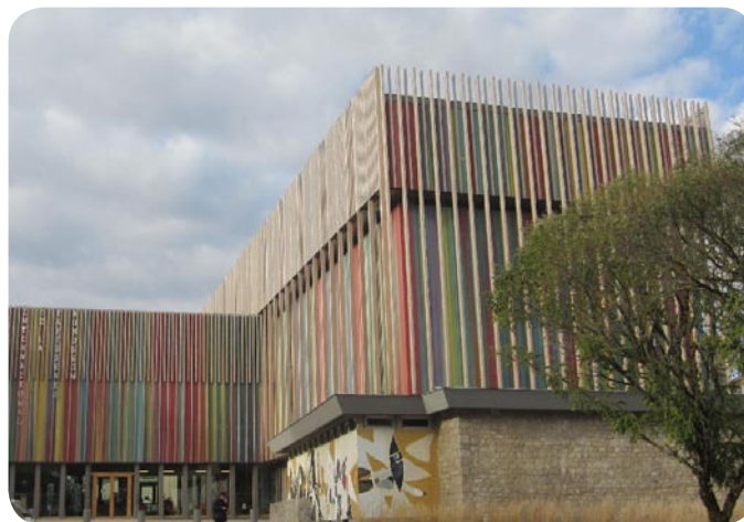
Cité internationale de la tapisserie à Aubusson

L'histoire de l'ancienne province de la Marche est marquée par les migrations saisonnières des maçons depuis le Moyen Âge qui seront à leur apogée à la fin du XIXe siècle lors des grandes transformations urbaines, dans le Paris d'Hausmann notamment.