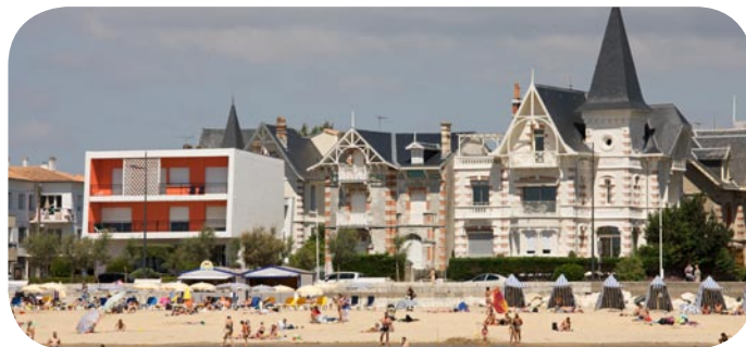
Royan front de mer

Ce département s'étire sur 170 km, entre le Marais poitevin au nord et l'estuaire de la Gironde au sud. Il est complété sur sa façade atlantique par quatre îles, dont l'île de Ré et l'île d'Oléron qui forment la mer des Pertuis. Ce département très attractif pour sa qualité de vie possède une forte dynamique démographique et urbaine.