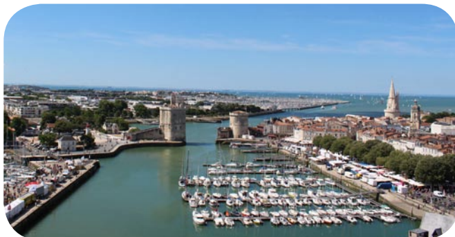
Vieux port ou havre d'échouage de La Rochelle

05.46.41.09.57 udap.charente-maritime@culture.gouv.fr