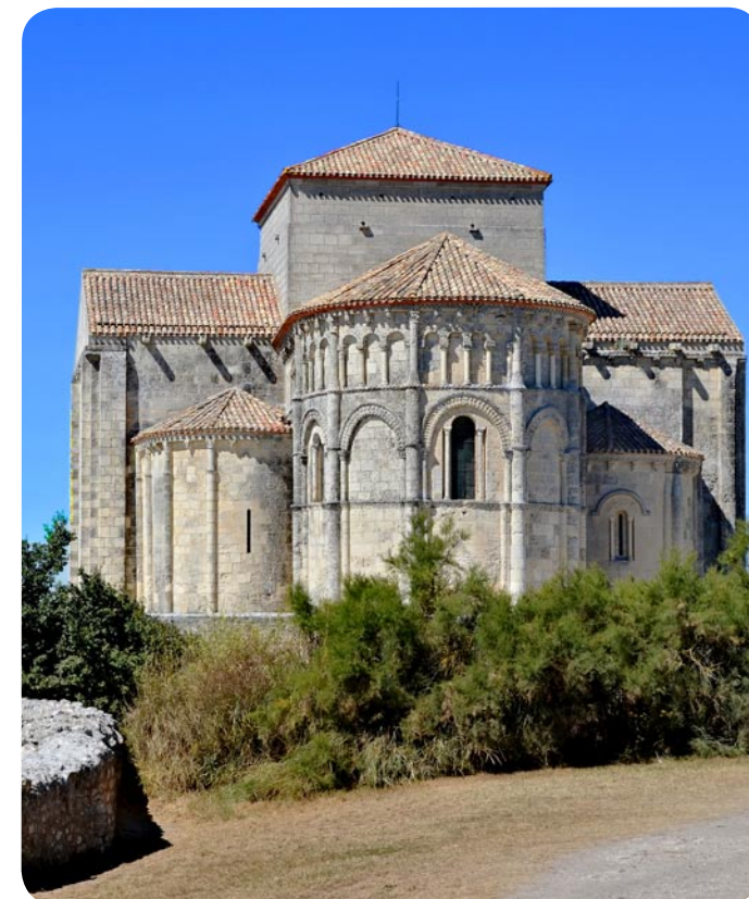
Eglise Sainte Radegonde de Talmont ©Par Photo JLPC Wikimedia Commons, CC BY-SA 3.0, https://commons.wikimedia.org/w/index.php?curid=28836898 copie.jpg

UDAP | Unité départementale de l'architecture et du patrimoine CHARENTE-MARITIME