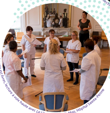
La voix est livrée, lecture à voix haute avec La Liseuse © Gilles le Mao, Hôpital Sainte-Périne

« La poésie a le pouvoir de lâcher-prise, de lever les préjugés. »