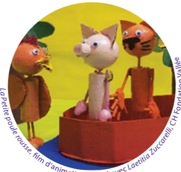
La Petite poule rousse, film d'animation réalisé avec Laetitia Zuccarelli, CH Fondation Vallée

« Je ne pensais pas qu'on irait aussi loin. »