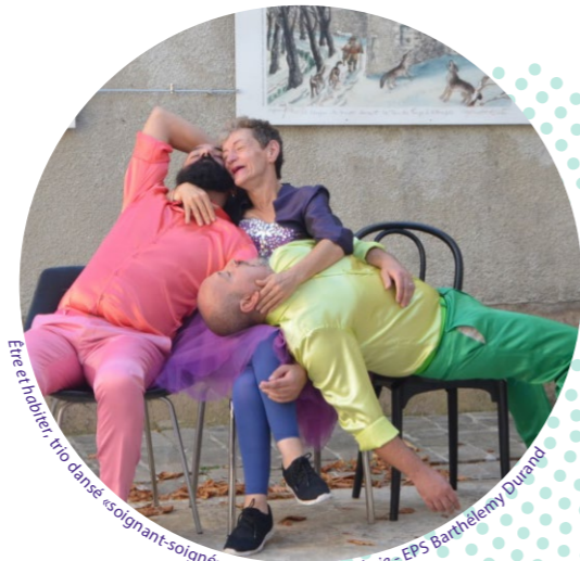
Ere habiter, trio dansé «soignant-soigné» avec La Halte-Gardejrie - EPS Barthélemy Durand

« Je n'aurais jamais imaginé faire de si belles rencontres dans un hôpital psychiatrique. Je ne savais pas non plus que la culture et la santé pouvaient être si intimement liées. La culture. Qu'est-ce que c'est la culture quand on a besoin de soins et que la vie est une difficulté douloureuse ? Qu'est-ce que la culture peut changer dans le quotidien des personnes soignées et des salariés d'un hôpital aussi vaste et aussi tentaculaire que l'EPS Barthélemy Durand ? Les réponses sont des noms d'artistes et de compagnies artistiques [...]. Les réponses sont aussi les courages et les timidités des patients qui, parfois vêtus d'un pauvre pyjama bleu, ont décidé, le temps d'une création artistique, d'être maîtres de leurs émotions et de leurs corps. Il en faut de la force et de la générosité pour parler dans un micro, tenir une caméra, peindre un nuage, se prendre pour Antigone, faire comme si on attendait Godot, écrire ensemble, dire les larmes cachées depuis si longtemps, rire aux éclats et chanter. Oui, chanter et danser encore parce que l'art qui entre à l'hôpital psychiatrique, ça donne envie de chanter, ça donne envie de danser. L'art est une joie. Une bulle de joie. Je suis joyeuse. » S.F.