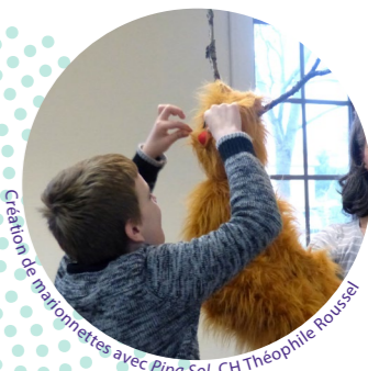
Création de marionnettes avec Pipa Sol, CH Théophile Roussel