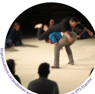
Improvisations circassiennes avec Un Loup pour l'homme, EPS Erasme