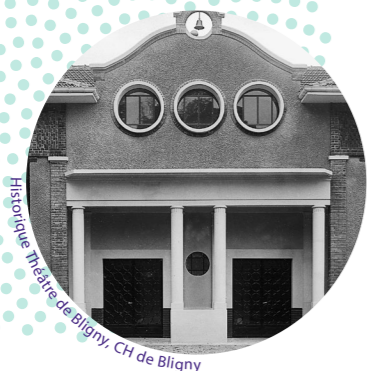
Hôpital de Bligny, CH de Bligny