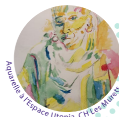
Aquarelle à l'Espace Utopia, CH Les Murets