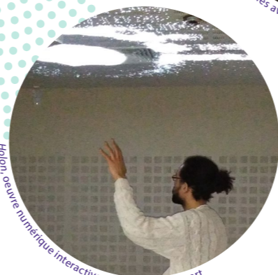
Hibou, œuvre numérique interactive, CH de Melun-Sénart