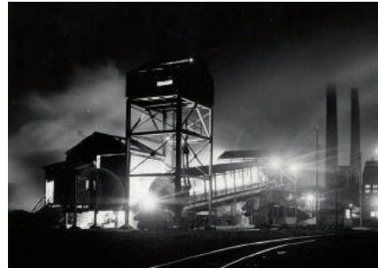
Fonds SMN La Fabrique de patrimoines

Association SMN Mémoire et Patrimoine SMN