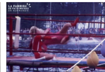
Fonds Ouistreham La Fabrique de patrimoines