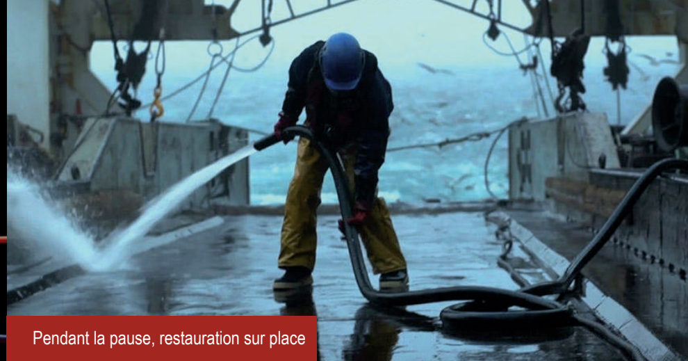
Pendant la pause, restauration sur place

20h35-21h05 / Rencontre avec Christophe Lamoureux, maître de conférences (sociologie) à l'UFR de sociologie de l'Université de Nantes et chercheur associé au CENS (Centre Nantais de Sociologie). Auteur de La grande parade du catch , Presses universitaires du Mirail, 1993.