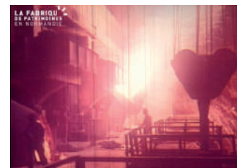
Fonds Minot La Fabrique de patrimoines

Pour commencer chaque demi-journée, La Fabrique de patrimoines en Normandie et Normandie Images vous proposent de découvrir quelques courts extraits de leurs fonds d'archives d'images amateurs en lien avec la thématique du festival.