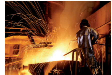
Fonds SMN La Fabrique de patrimoines