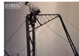
Fonds Théaux La Fabrique de patrimoines