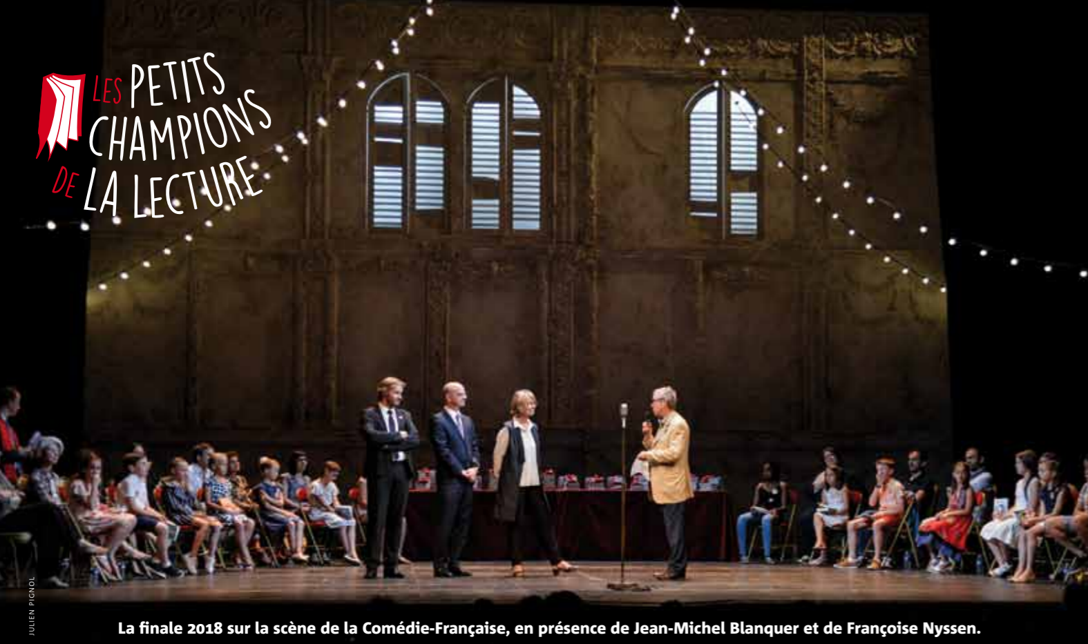
La finale 2018 sur la scène de la Comédie-Française, en présence de Jean-Michel Blanquer et de Françoise Nyssen.

Les enfants des classes de CM2 sont invités à lire en public un court texte de leur choix, extrait d'une œuvre de fiction, pendant trois minutes maximum. Ils peuvent participer au sein de leur classe ou au sein d'un groupe sous la responsabilité d'un médiateur du livre.