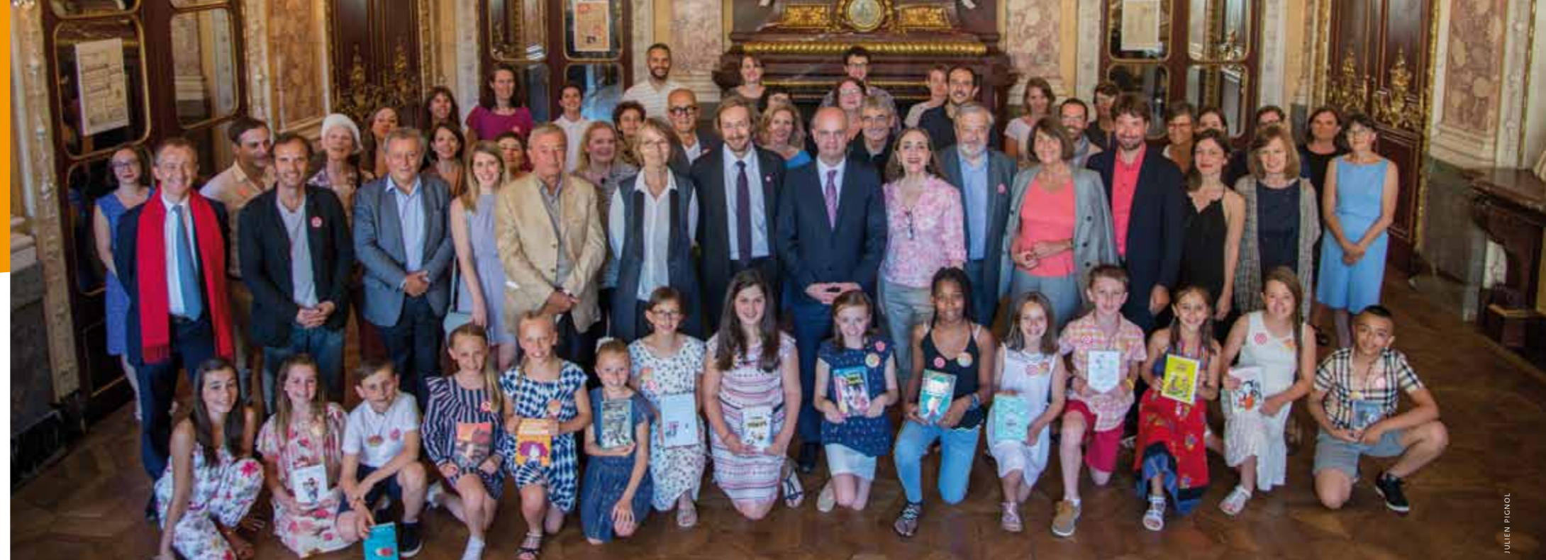
Jean-Michel Blanquer, Françoise Nyssen, les finalistes, les auteurs, le jury et les parrains de la sixième édition.

Dès l'accueil, il est recommandé de rappeler aux parents qu'il s'agit d'un jeu, de féliciter les enfants présents et de mettre l'accent sur le fait que ce n'est pas la victoire mais l'expérience de lecture à voix haute qui est importante.