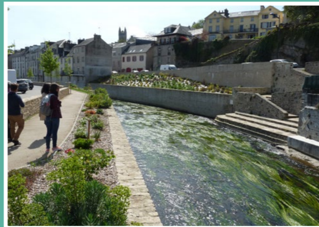
Réaménagement des berges de l'Isole à Quimperlé suite aux inondations de 2013 et 2014