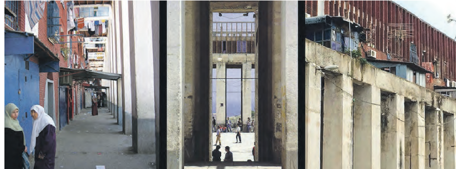
200 colonnes, Fernand Pouillon

Toulouse Centre des Cultures de l'Habiter – 5 Rue St-Pantaléon, jusqu'au 26 mai 12h30/19h (du mercredi au vendredi) 14h30/19h (samedi) UNE ARCHITECTURE DURABLE: LES 200 COLONNES DE FERNAND POUILLON [exposition] Autour de l'œuvre de Fernand Pouillon. Faire Ville : 05 61 21 61 19