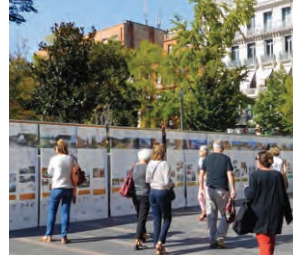
Exposition 40 ans d'archi à Toulouse

Maison de l'architecture Occitanie-Pyrénées : 05 61 53 19 89