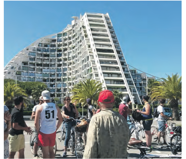
Balade urbaine à vélo – La Grande-Motte