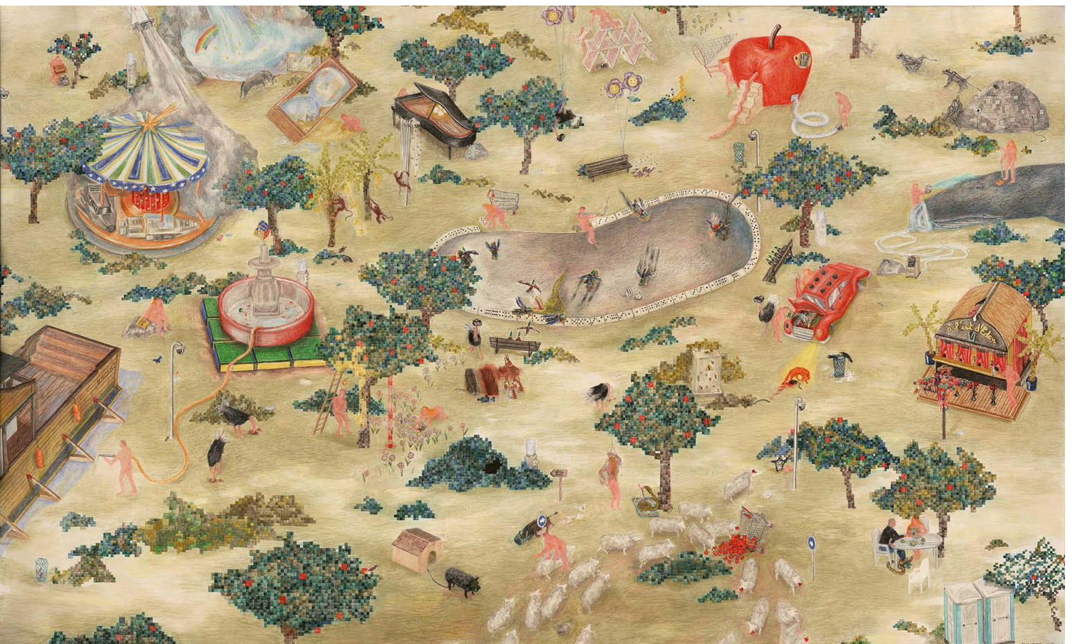
«A l'Ouest d'Eden» de Bianca Argimon, 2017 dessin aux crayons de couleur (143cm x 86cm)