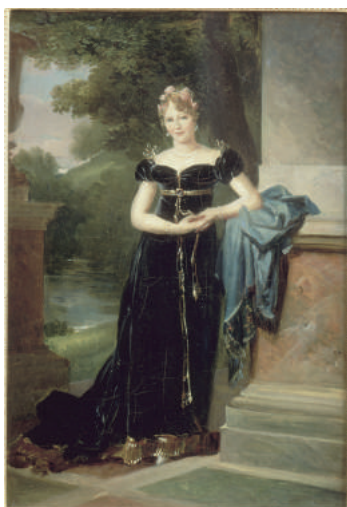
Marie Walewska François Baron Gérard 1812 - Peinture sur toile H. 32,8 ; L. 22,9cm