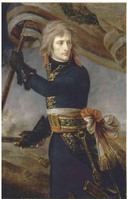
Le Général Bonaparte à Arcole Antoine-Jean Gros (1770-1835) 1796 - Huile sur toile H. 130 ; L. 94 cm Dépôt du département des Peintures du musée du Louvre, 1938

Parti pour l'Italie en 1793, en pleine tourmente, Antoine-Jean Gros s'installa à Florence, puis à Gênes, où il vécut de ses portraits, protégé par un groupe de personnalités influentes, italiennes et françaises. Il rencontra là, en novembre 1796, Joséphine Bonaparte, l'épouse du général, et la suivit à Milan « dans la seule espérance de parvenir à faire le portrait du général dont la gloire et les détails [qu'on] donnait de sa physionomie ne faisaient qu'irriter ce désir ». La rencontre eut lieu au palais Serbelloni, où résidait Bonaparte, qui posa pour un dessin dont le jeune artiste tira ce fameux portrait. Il était terminé en février 1797, et représente le général Bonaparte au combat d'Arcole, le 15 novembre 1796. Si la légende veut que Bonaparte ait chargé, à la tête de ses troupes et le drapeau à la main, sur le pont, sous le feu de l'ennemi, on sait qu'il en fut autrement, qu'il fut repoussé, tomba du pont dans la rivière, et ne fut sauvé que par la présence d'esprit de ses proches. Il lui faudra trois jours pour venir à bout de la résistance autrichienne. Malgré sa facture très libre et le sentiment de modernité qu'elle donne, l'œuvre s'inspire beaucoup des portraits de généraux au combat des siècles précédents. L'énergie de la pose et le regard farouche du général l'en distinguent cependant et fixent, dès sa première campagne et pour longtemps, l'image du héros invincible. Exposé au Salon de 1801, et très vite gravé, le tableau connaît une célébrité rapide.