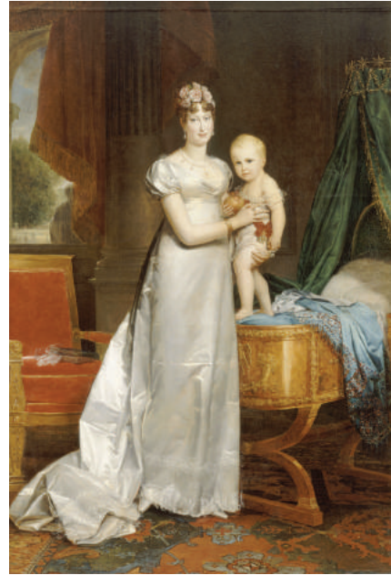
Marie-Louise, impératrice des Français (1791-1847) et le roi de Rome François Gérard