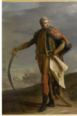
François-Joseph Lefebvre (1755-1820), maréchal de l'Empire Césarine Davin (1773-1844) 1807 - Huile sur toile H. 217,5 ; L. 141,5 cm