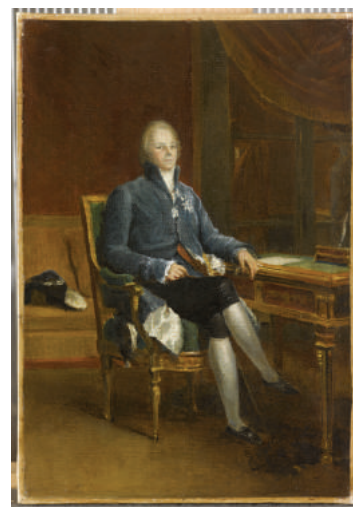
Charles-Maurice de Talleyrand-Périgord, prince de Bénévent François Baron Gérard 1808 - Peinture sur toile H. 32,5 ; L. 22,5cm

Unissant les raffinements du XVIII e siècle aux codes de représentation les plus modernes, Gérard connu un très grand succès dans l'art du portrait, sachant toujours se renouveler dans la mise en page et renvoyant à ses modèles l'image de l'élégance la plus flatteuse. Il livra entre 1796 et 1836 plus de quatre-vingt portraits en pied, répétés en nombre par son atelier, dont Versailles conserve les réductions, esquisses ou riccordi, de sa main ou de l'atelier, acquises de sa veuve en 1837. Elles dressent le portrait de la famille impériale et de l'entourage de l'Empereur, constituant un véritable Who's Who de l'Empire.