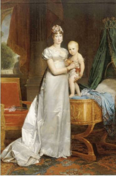
Marie-Louise, impératrice des Français (1791-1847), et le roi de Rome (1811-1832) François Gérard (1770-1837) 1812 - Huile sur toile H. 240,5 ; L. 163 cm