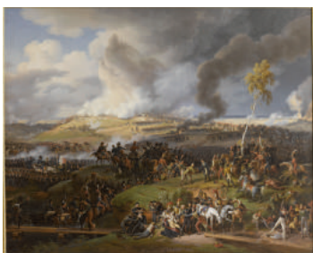
Bataille de La Moskova, le 7 septembre 1812 Louis-François Lejeune (1775-1848) 1822 - Huile sur toile H. 210 ; L. 264 cm