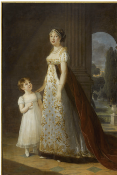
Caroline Murat (1782-1839), reine de Naples, avec sa fille Letizia (1802-1859) Louise Élisabeth Vigée-Le Brun (1755-1842) 1806-1807 - Huile sur toile H. 216,5 ; L. 143,5 cm