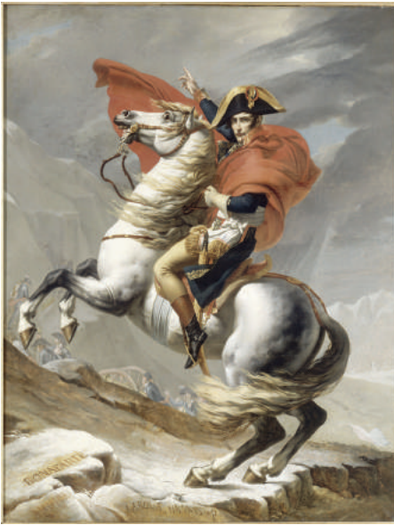
Bonaparte, Premier Consul, franchissant le Grand-Saint-Bernard, le 20 mai 1800 Jacques-Louis David (1748-1825) Huile sur toile H. 2,73 ; L. 2,34 m.

Il n'y a pas d'image plus emblématique de Napoléon chef de guerre que ce célèbre portrait de David, commandé au retour de la seconde campagne d'Italie. Le modèle aurait demandé à l'artiste de le représenter « calme sur un cheval fougueux » et David y parvint d'une manière magistrale. Il fixe ici l'image du héros des temps modernes, ouvrant une ère nouvelle, tout en le présentant comme l'héritier des grands héros du passé, symbolisés par les noms d'Hannibal et Charlemagne, gravés dans le rocher à ses pieds.