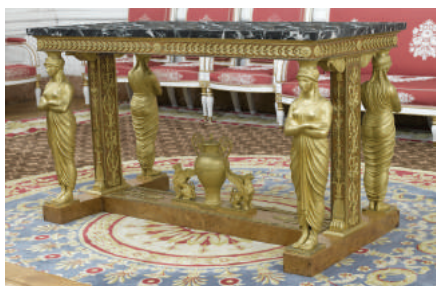
Table-console de l'Élysée-Murat François-Honoré-Georges Jacob, dit Jacob-Desmalter (1770-1841) 1803-1806 Orme, bronze ciselé et doré, marbre vert de mer H. 92 ; L. 140 ; P. 73 cm