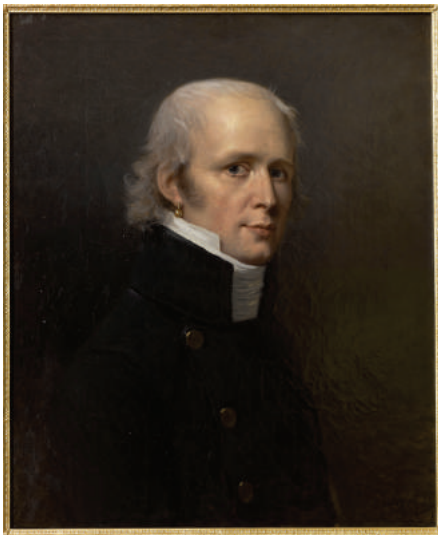
Charles Percier (1764-1838) Robert Lefèvre (1755-1830) 1807 - Huile sur toile H. 65,5 ; L. 54,5 cm