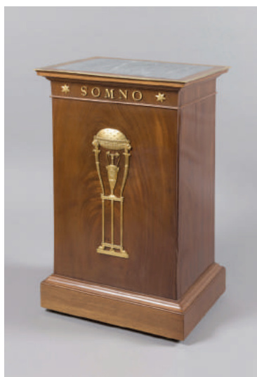
Somno de la chambre du Premier Consul au palais des Tuileries Jacob-Frères (1796-1803) 1800 - Acajou, bronze doré, marbre bleu turquin H. 83 ; L. 50 ; P. 40,5

Le somno fut un meuble adopté par Napoléon dans tous ses palais. Il s'agit d'une table de nuit en forme de piédestal à l'antique, dont on présente le dos orné d'un décor de bronze doré. La façade, avec pot de chambre et tablette derrière une porte, est tournée vers le lit. Son nom lui vient précisément de l'inscription portée sur cet exemplaire, le plus ancien connu, qui en latin signifie : « Je dors ». En réalité, il y en eut trois livrés en même temps en 1800, avec quelques différences dans les décors. Celui-ci se trouvait dans la chambre de l'Empereur au palais des Tuileries. Il est orné d'un brûle-parfum en forme de trépied antique, motif à la mode, qui servit aussi pour concevoir des lavabos, tels ceux de l'Empereur.