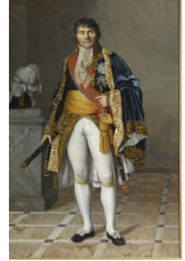
Jean Lannes (1769-1809), maréchal de l'Empire Jean-Charles-Nicolas Perrin (1754-1831) 1805 - Huile sur toile H. 218 ; L. 142 cm

L'origine militaire du pouvoir impérial se traduisait dans le décor des palais. Aux Tuileries, le premier d'entre eux, véritable cœur battant de l'Empire, la grande salle centrale devint le « salon des Maréchaux ». Dans un somptueux décor imaginé par Percier et Fontaine prirent place les portraits des officiers généraux promus à la dignité de « Maréchal de l'Empire ». Aux quatorze maréchaux de la première promotion, s'en ajoutèrent quatre, honoraires, et d'autres au fil des années, mais les emplacements restèrent invariablement au nombre de seize, correspondant au nombre des vivants, en activité.