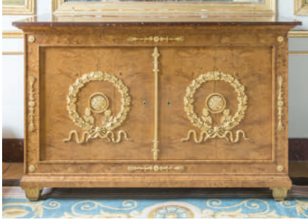
Bas d'armoire formant serre-papiers pour le cabinet particulier de l'empereur au Grand Trianon François-Honoré-Georges Jacob, dit Jacob-Desmalter (1770-1841) 1813 - Racine d'orme, bronze cise- lé et doré, marbre griotte d'Italie H. 99,4 ; L. 147,4 ; P. 57,2 cm

Le cabinet particulier de l'Empereur est l'une des cinq pièces en enfilade du petit appartement privé de Napoléon au Grand Trianon. Lors de son dernier séjour du 7 au 23 mars 1813, l'aménagement de la pièce n'était pas encore achevé. Pour le service de l'Empereur, l'administration avait commandé à Jacob Desmalter une paire de serre-papiers, car Napoléon en possédait dans tous les palais impériaux, pour ranger ses documents personnels tels que cartes, plans, lettres, livres. Ce meuble, couvert d'un plateau en marbre griotte d'Italie, repose sur des pieds en bois doré formant culots, et présente deux vantaux entourés d'un encadrement fixe rehaussé de moulures en bois massif d'orme. L'intérieur est garni de deux tablettes en chêne et de bois d'orme sur le devant. Depuis le blocus continental, décrété en 1806, les ébénistes parisiens étaient incités à utiliser de nouveaux matériaux, dont les bois français d'essence claire, dits « indigènes ». La richesse décorative de l'ensemble est rehaussée par d'importants bronzes ciselés et dorés au mat. Sur les portes deux couronnes de feuilles de chêne enrubannées, entouraient à l'origine un aigle impérial, remplacé en 1815 par une fleur de lys, puis en 1831 par la rosace encore visible aujourd'hui. Un thyrses antique cache la jointure des deux battants et les encadrements sont soulignés de rosaces, fleurons et palmettes.