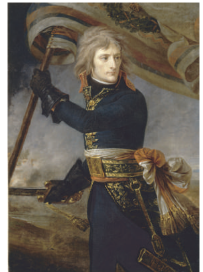
Bonaparte au pont d'Arcole, le 17 novembre 1796 Antoine-Jean Gros