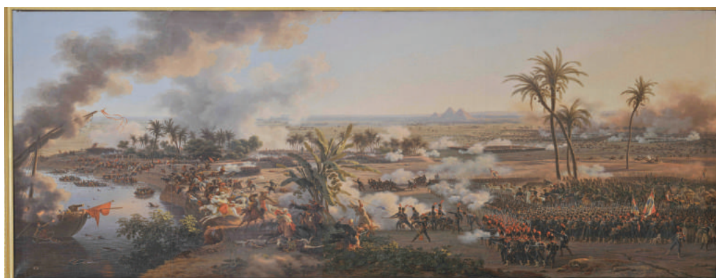
Bataille des Pyramides, le 21 juillet 1798 Louis-François Lejeune (1775-1848) 1806 - Huile sur toile H. 183,5 ; L. 421 cm

Parti pour l'Italie en 1793, en pleine tourmente, Antoine-Jean Gros s'installa à Florence, puis à Gênes, où il vécut de ses portraits, protégé par un groupe de personnalités influentes, italiennes et françaises. Il rencontra là, en novembre 1796, Joséphine Bonaparte, l'épouse du général, et la suivit à Milan « dans la seule espérance de parvenir à faire le portrait du général dont la gloire et les détails [qu'on] donnait de sa physionomie ne faisaient qu'irriter ce désir ». La rencontre eut lieu au palais Serbelloni, où résidait Bonaparte, qui posa pour un dessin dont le jeune artiste tira ce fameux portrait. Il était terminé en février 1797, et représente le général Bonaparte au combat d'Arcole, le 15 novembre 1796. Si la légende veut que Bonaparte ait chargé, à la tête de ses troupes et le drapeau à la main, sur le pont, sous le feu de l'ennemi, on sait qu'il en fut autrement, qu'il fut repoussé, tomba du pont dans la rivière, et ne fut sauvé que par la présence d'esprit de ses proches. Il lui faudra trois jours pour venir à bout de la résistance autrichienne. Malgré sa facture très libre et le sentiment de modernité qu'elle donne, l'œuvre s'inspire beaucoup des portraits de généraux au combat des siècles précédents. L'énergie de la pose et le regard farouche du général l'en distinguent cependant et fixent, dès sa première campagne et pour longtemps, l'image du héros invincible. Exposé au Salon de 1801, et très vite gravé, le tableau connaît une célébrité rapide.