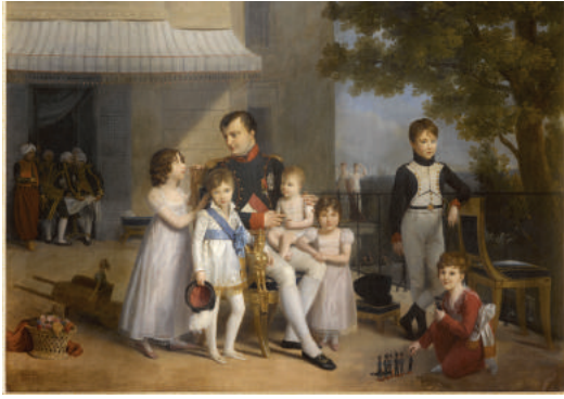
L'Empereur Napoléon I er et ses neveux sur la terrasse du château de Saint-Cloud Louis Ducis (1775-1847) 1810 - Huile sur toile H. 111,5 ; L. 143,5 cm

Sur la terrasse de l'orangerie du château de Saint-Cloud, entouré de ses neveux et nièces, l'Empereur est assis, vêtu de l'habit de colonel des chasseurs à cheval de la Garde impériale. Au fond, des domestiques de sa maison rentrent la table de son déjeuner, sous la surveillance du mameluck Roustan. Les mères des enfants, les reines Hortense et Caroline, observent la scène depuis le balcon qui fait le tour du château. Les enfants sont, de gauche à droite, Letizia Murat (1802-1859), les deux frères Napoléon-Louis (1804-1831) et Louis-Napoléon Bonaparte (1808-1873), le futur Napoléon III, sur les genoux de l'Empereur, puis Louise (1805-1889), Achille (1801-1847), et Lucien Murat (1803-1878), jouant avec de petits soldats. Mis en scène de façon un peu artificielle, ce portrait de groupe illustre bien la question de la succession impériale. Portraitiste aux ambitions modestes, Ducis reprit pour son tableau les images des enfants données par François Gérard peu avant : les Murat, dans le portrait de groupe avec leur mère, les Bonaparte, dans celui d'Hortense avec son fils cadet ; tous deux peints pour le salon de famille de Saint-Cloud en 1808. Présenté au Salon de 1810, le tableau appartenait alors au général Rapp. Il fut acquis par l'empereur Napoléon III en 1855 qui en fit don au musée de Versailles en 1868.