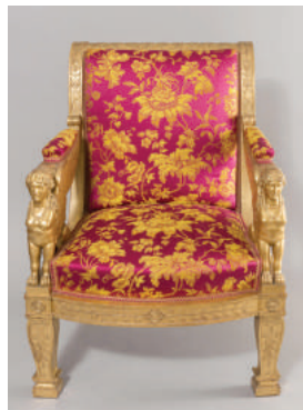
Fauteuil du salon de l'impératrice Joséphine au palais des Tuileries Jacob-Desmalter (à partir de 1803) 1807-1808 Bois sculpté et doré, soie H. 96,5 ; L. 69 ; P. 66 cm

Le cabinet particulier de l'Empereur est l'une des cinq pièces en enfilade du petit appartement privé de Napoléon au Grand Trianon. Lors de son dernier séjour du 7 au 23 mars 1813, l'aménagement de la pièce n'était pas encore achevé. Pour le service de l'Empereur, l'administration avait commandé à Jacob Desmalter une paire de serre-papiers, car Napoléon en possédait dans tous les palais impériaux, pour ranger ses documents personnels tels que cartes, plans, lettres, livres. Ce meuble, couvert d'un plateau en marbre griotte d'Italie, repose sur des pieds en bois doré formant culots, et présente deux vantaux entourés d'un encadrement fixe rehaussé de moulures en bois massif d'orme. L'intérieur est garni de deux tablettes en chêne et de bois d'orme sur le devant. Depuis le blocus continental, décrété en 1806, les ébénistes parisiens étaient incités à utiliser de nouveaux matériaux, dont les bois français d'essence claire, dits « indigènes ». La richesse décorative de l'ensemble est rehaussée par d'importants bronzes ciselés et dorés au mat. Sur les portes deux couronnes de feuilles de chêne enrubannées, entouraient à l'origine un aigle impérial, remplacé en 1815 par une fleur de lys, puis en 1831 par la rosace encore visible aujourd'hui. Un thyrses antique cache la jointure des deux battants et les encadrements sont soulignés de rosaces, fleurons et palmettes.