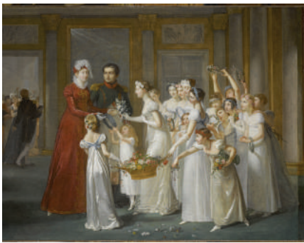
Arrivée de Napoléon et Marie-Louise à Compiègne, le 28 mars 1810 Pauline Auzou (1775-1835) 1810 - Huile sur toile H. 114,5 ; L. 153 cm

Sur la terrasse de l'orangerie du château de Saint-Cloud, entouré de ses neveux et nièces, l'Empereur est assis, vêtu de l'habit de colonel des chasseurs à cheval de la Garde impériale. Au fond, des domestiques de sa maison rentrent la table de son déjeuner, sous la surveillance du mameluck Roustan. Les mères des enfants, les reines Hortense et Caroline, observent la scène depuis le balcon qui fait le tour du château. Les enfants sont, de gauche à droite, Letizia Murat (1802-1859), les deux frères Napoléon-Louis (1804-1831) et Louis-Napoléon Bonaparte (1808-1873), le futur Napoléon III, sur les genoux de l'Empereur, puis Louise (1805-1889), Achille (1801-1847), et Lucien Murat (1803-1878), jouant avec de petits soldats. Mis en scène de façon un peu artificielle, ce portrait de groupe illustre bien la question de la succession impériale. Portraitiste aux ambitions modestes, Ducis reprit pour son tableau les images des enfants données par François Gérard peu avant : les Murat, dans le portrait de groupe avec leur mère, les Bonaparte, dans celui d'Hortense avec son fils cadet ; tous deux peints pour le salon de famille de Saint-Cloud en 1808. Présenté au Salon de 1810, le tableau appartenait alors au général Rapp. Il fut acquis par l'empereur Napoléon III en 1855 qui en fit don au musée de Versailles en 1868.