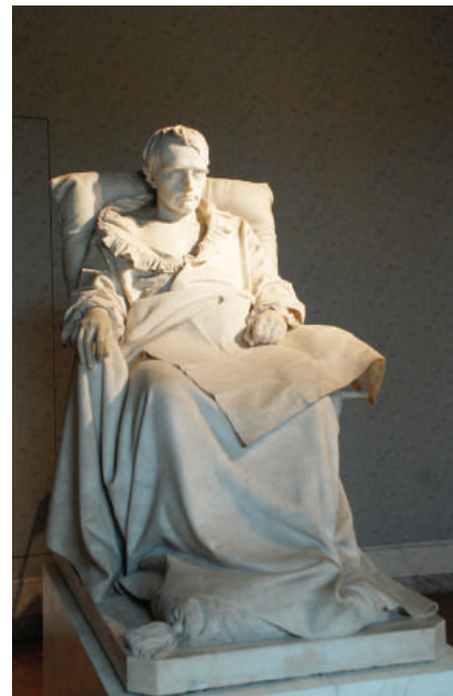
Les derniers moments de Napoléon I er à Sainte-Hélène Vincenzo Vela