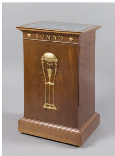
Somno de la chambre du Premier Consul au palais des Tuileries Jacob-Frères (1796-1803)