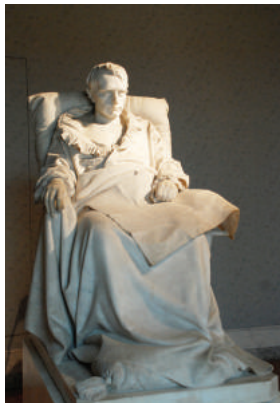
Les derniers jours de Napoléon I er Vincenzo Vela (1820-1891) 1866 - Marbre H. 144 ; L. 97 ; P. 132,5 cm

Soutenu par un grand coussin, la chemise entrouverte, les jambes enveloppées dans une couverture, les traits tirés par la maladie, Napoléon vit ses derniers instants. L'Empereur déchu regarde encore droit devant lui – mais ses yeux, hagards, sont déjà ceux d'un mourant – et son poing se crispe avec peine pour retenir une carte de l'Europe – de cette Europe conquise par ses armées et désormais définitivement perdue. Cette scène dramatique est censée se dérouler dans l'île de Sainte-Hélène, au milieu de l'Océan atlantique et au large des côtes africaines, où l'Empereur fut relégué après la défaite de Waterloo en 1815 et où il mourut le 5 mai 1821. La statue de Vela, un des principaux représentants italiens du courant naturaliste, fut présentée à l'exposition universelle de 1867 à Paris, où elle rencontra un accueil plutôt favorable de la part du public. Napoléon III fit l'acquisition de l'œuvre en 1867, pour le musée de Versailles. Il en possédait une photographie dans son appartement du palais des Tuileries.