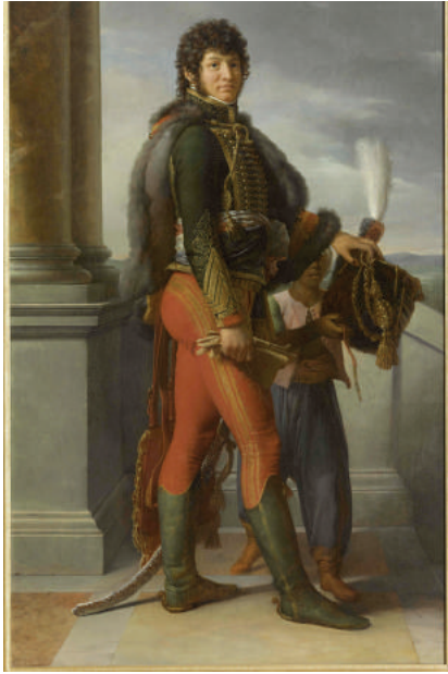
Joachim Murat (1767-1815) François Gérard (1770-1837) 1801-1802 - Huile sur toile H. 213,5 ; L. 131,5 cm