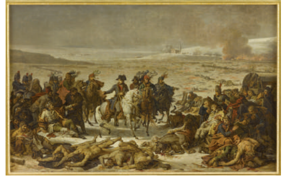
Napoléon parcourant le champ de bataille d'Eylau, 9 février 1807 Charles Meynier