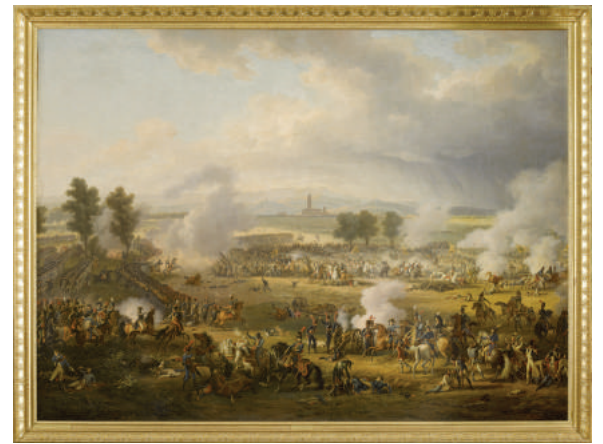
Bataille de Marengo, 14 juin 1800 Louis-François Lejeune.