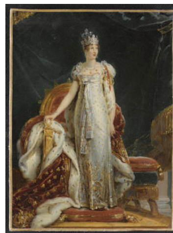
Marie-Louise, impératrice des Français (1781-1847) François Baron Gérard 1812 - Peinture sur toile H. 31,2 ; L. 24