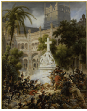
Prise du monastère de San Engracia, à Saragosse, le 8 février 1809 Louis-François, baron Lejeune (1775-1848) 1827 Huile sur toile H. 150 ; L. 128 cm