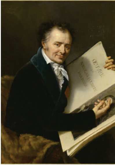
Dominique Vivant, baron Denon (1747-1825), directeur général du Musée Napoléon Robert Lefèvre (1755-1830) 1808 - Huile sur toile H. 101 ; L. 81,5 cm