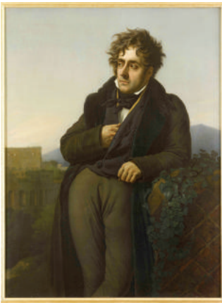
François-René, vicomte de Chateaubriand (1768-1848) Anne-Louis Girodet (1767-1824) 1811 - Huile sur toile H. 130 ; L. 97,5 cm