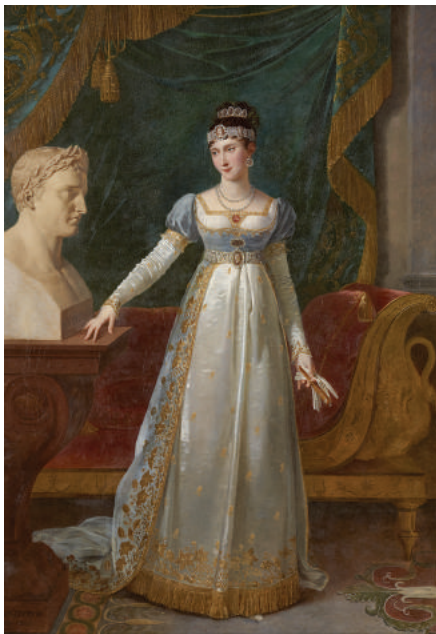
Pauline Bonaparte, duchesse de Guastalla, princesse Borghese Robert Lefèvre