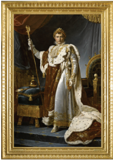
Napoléon I er (1769-1821), empereur des Français François Gérard (1770-1837) Huile sur toile H. 2,23 ; L. 1,43 m.

En 1804, François Gérard fut choisi pour représenter l'Empereur en grand costume de sacre. Achevé au début de 1805, le portrait était destiné à Talleyrand, ministre des Relations extérieures. Mais dès le mois de décembre 1804, le ministre de l'Intérieur, Champagny, commandait à l'artiste une série de répliques pour les membres de la famille impériale, les dignitaires du régime, les ambassades françaises et pour être offertes en cadeau aux représentants de l'étranger. On en connaît aujourd'hui de nombreux exemplaires, dispersés à travers le monde. En outre, une très belle gravure de Boucher-Desnoyers (1808) contribua à la diffusion de ce portrait, image officielle de Napoléon qui traduit le mieux la majesté impériale.