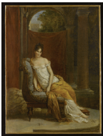
Juliette Récamier François Baron Gérard 1802 - Peinture sur toile H. 32,3 ; L. 24,5cm