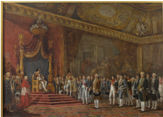
Députation du Sénat romain (Goubaud)