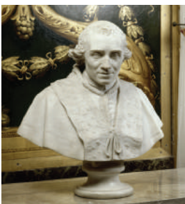
Pie VII (1742-1823), pape Antonio Canova (1757-1822) Vers 1804-1805 - Marbre H. 71 (dont piédouche : 15) ; L. 60 ; P. 31 cm