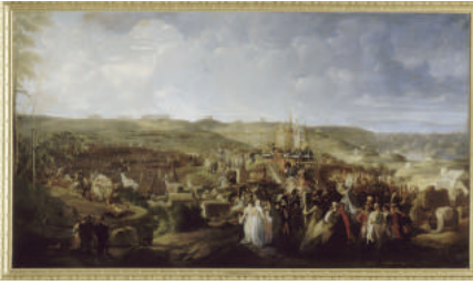
Napoléon distribue des croix de la Légion d'honneur au camp de Boulogne, le 16 août 1804 Philippe-Auguste Hennequin (1762-1833) 1804-1806 Huile sur toile H. 319 ; L. 483 cm

Élève de David, ayant obtenu le Grand Prix du Salon de 1800, Hennequin fut un républicain convaincu, opposé à Bonaparte. Néanmoins, Denon, directeur du musée Napoléon, tenta de le rallier à la cause de l'Empereur. En juillet 1804, l'artiste partit pour le camp de Boulogne, où se formait la Grande Armée destinée à l'invasion de l'Angleterre, pour assister à la cérémonie de remise des croix de la Légion d'honneur, Denon voulant lui commander une peinture commémorative. Le peintre commença le tableau sur place, mais l'acheva à Paris et le fit graver. L'œuvre, exposée au Salon, déçut les tenants du nouveau régime, qui s'attendaient à voir l'Empereur mis en valeur. Si la topographie des lieux est exacte, si l'on reconnaît bien les différents corps d'armée, Napoléon est debout sur une estrade, noyé dans la masse des participants. Au premier plan, Hennequin s'est plu à placer différents types de personnages populaires, rappelant ses choix politiques. Hennequin ne fut pas le seul artiste opposant au régime impérial, mais il fut sans doute le plus radical et dut s'exiler en Belgique en 1806, au moment où il exposait son tableau.