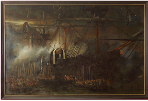
Transbordement du cercueil de Napoléon I er à bord de la Belle Poule, le 15 octobre 1840 Eugène Isabey, 1803-1886 1842 - Huile sur toile H. 237,5 ; L. 369,5 cm