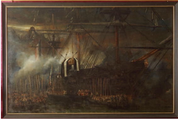
Enlèvement du cercueil de Napoléon I er à bord de la frégate «La Belle Poule», 15 octobre 1840 Eugène Isabey Photo © RMN-GP (château de Versailles) / Christophe Fouin