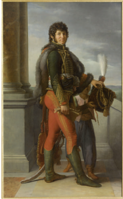
Joachim Murat (1767-1815), maréchal d'Empire François Gérard