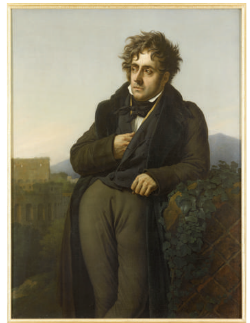
François-René, vicomte de Chateaubriand (1768-1848) Anne-Louis Girodet