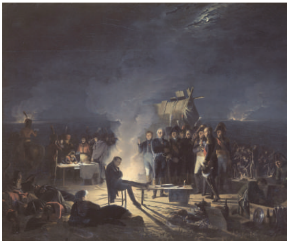
Bivouac de Napoléon I er sur le champ de bataille de Wagram, nuit du 5 au 6 juillet 1809, Adolphe-Eugène-Gabriel Roehn