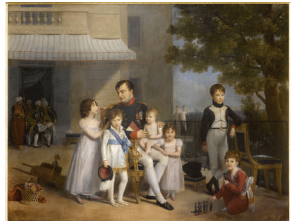
Napoléon et ses neveux à Saint-Cloud (Ducis)