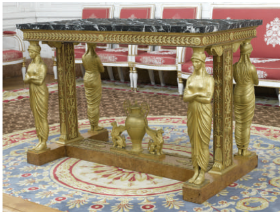
Table-console de l'Élysée-Murat par Jacob-Desmalter (1803-1806)