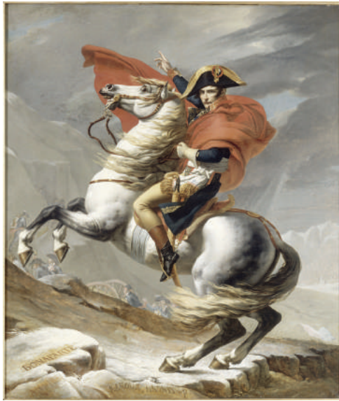
Bonaparte franchissant le Grand-Saint-Bernard, Jacques-Louis David.