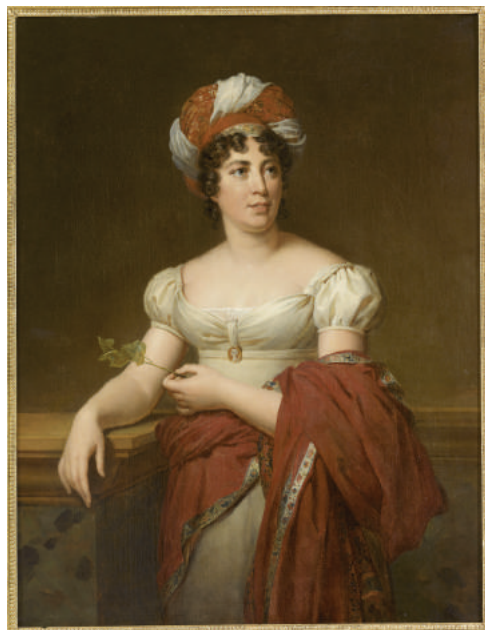
Anne-Louise-Germaine Necker, baronne de Staël-Holstein (1766-1817), Marie-Eléonore Godefroid