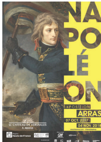
Affiche de l'exposition « Napoléon, image de la légende »

Légendes et crédits des visuels libres de droits pour la presse