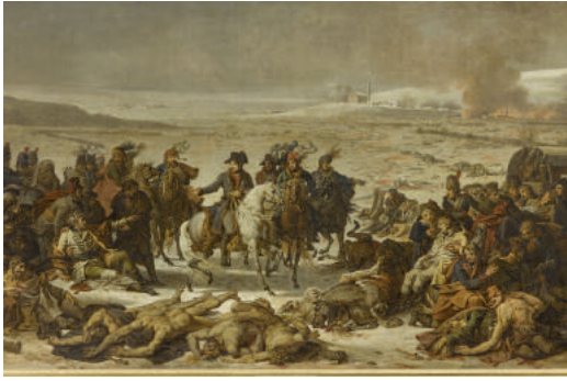
Napoléon sur le champ de bataille d'Eylau, le 9 février 1807 Charles Meynier (1768-1832) 1807 - Huile sur toile H. 93 ; L. 146 cm

La difficile victoire d'Eylau, discutée puisque les Russes quittèrent le champ de bataille en bon ordre à la nuit, avait provoqué la mort de nombreux généraux et la perte de 20 à 25 000 soldats français. Face à ce désastre, Napoléon résolut de rester sur place durant une semaine pour soigner les blessés et tenter de calmer les critiques qui auraient pu se faire jour. Il décida aussi qu'un concours de peinture aurait lieu pour commémorer l'événement. Denon fut chargé de fournir un cahier des charges aux artistes, ce qui explique que les esquisses des différents participants soient très proches les unes des autres. Parmi ces artistes, on relève les noms de Debret, Zix, Roehn, Gros, etc. La composition de l'esquisse de Meynier est très proche du tableau de Gros, qui obtint finalement la commande, exposé au Salon de 1808 et conservé au Louvre. L'esquisse de Meynier reste froide et simplement descriptive, peu inspirée, peut-être parce que le peintre était demeuré démocrate et restait critique envers le régime impérial.