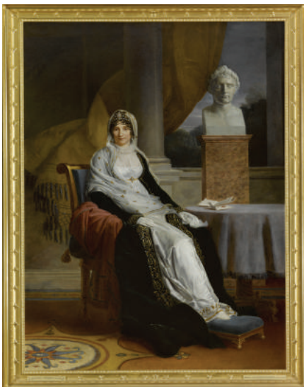
Maria-Letizia Bonaparte (1750-1836), née Ramolino François Gérard (1770-1837) 1805 - Huile sur toile H. 216,5 ; L. 143,5 cm

Charles Bonaparte meurt en 1785. Sa veuve, Letizia Ramolino et ses enfants sont chassés de Corse par la Révolution en 1793 et trouvent refuge en France.