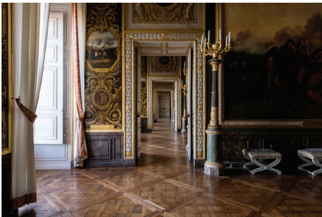
Enfilade des salles de l'Empire au rez-de-chaussée de l'aile du Midi

Elles sont présentées ici sous forme de reproductions, en projection, par groupes de trois, et dans un ordre chronologique, ce qui correspond à l'organisation de ces espaces. Créations de Gros, Regnault, Girodet, Guérin, Meynier, Carle Vernet, Debret, Serangeli, Benvenuti, etc., elles font partie des icônes de la légende impériale et de notre imaginaire collectif depuis le XIX e siècle puisqu'elles sont reproduites depuis dans les livres d'histoire, d'art et de littérature.