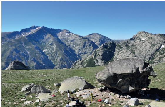
Corte, Abri Castelli