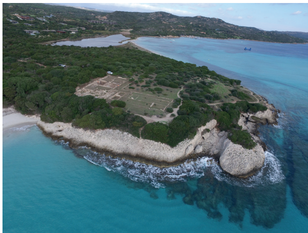
Bonifacio, villa de Piantarella