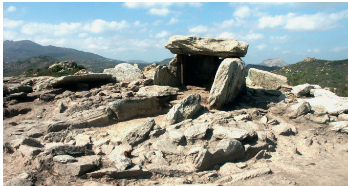
Santo-Pietro-di-Tenda, Casa di l'Urcu