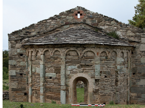
Valle-di-Rostino, Santa Maria di Rescamone