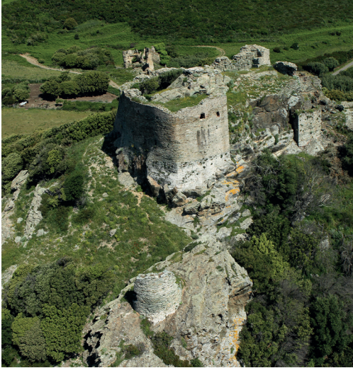
Rogliano, Castellu San Colombanu