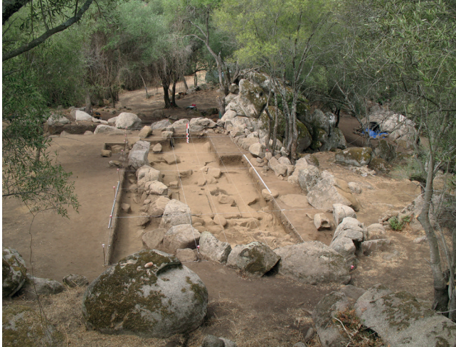
Sollacaro, Campo Stefanu, cliché F. Leandri