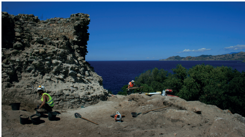
Belgodère, Tour de Lozari