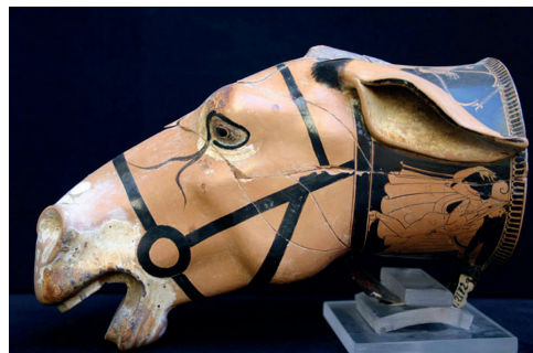
Aléria, rhyton attique