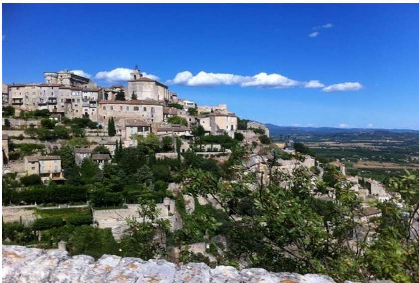
Château de Gordes et ses abords

La présente fiche a pour objet de présenter les abords de monuments historiques qui permettent la protection de l'environnement architectural, urbain et paysager des monuments historiques.