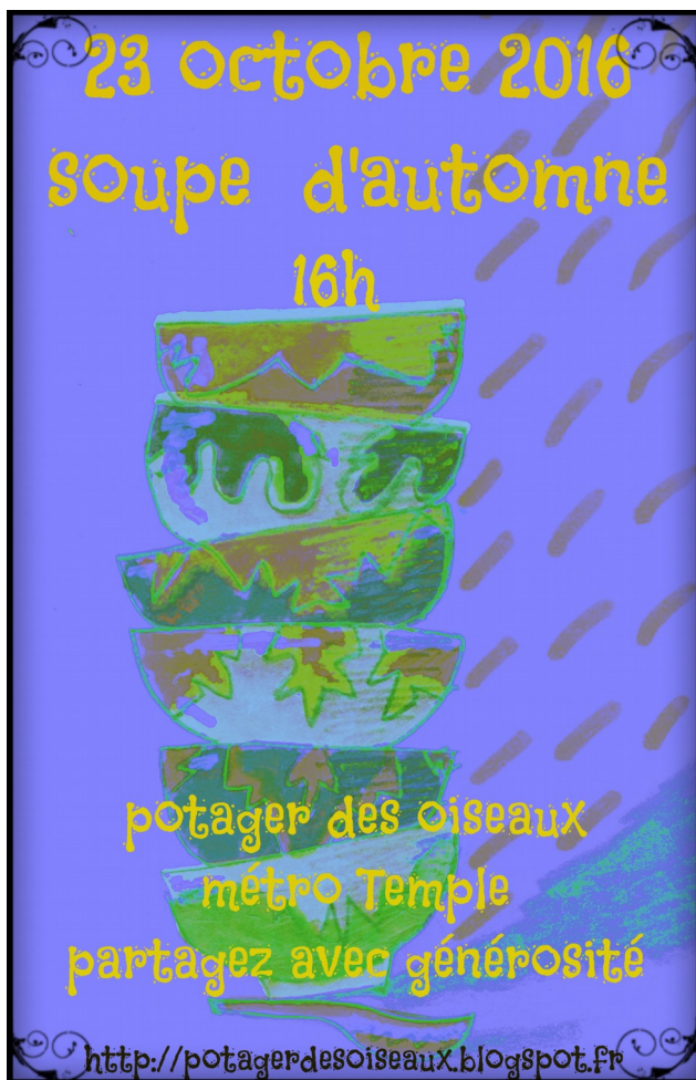
Affiche du Potager des oiseaux, Paris 3e