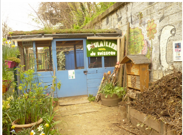
Poulailler et hôtel à insectes, Jardins du Ruisseau, Paris 18e