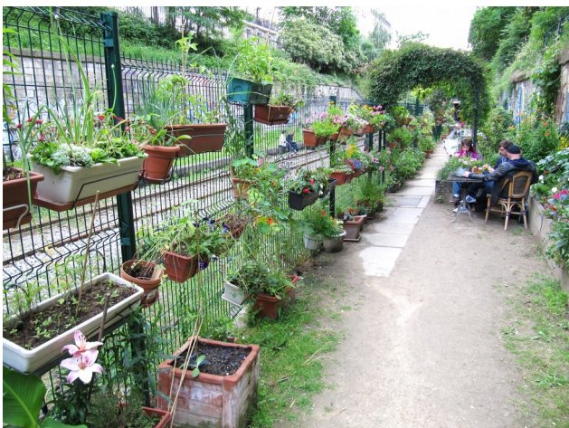
Les jardins du Ruisseau, Paris 18e