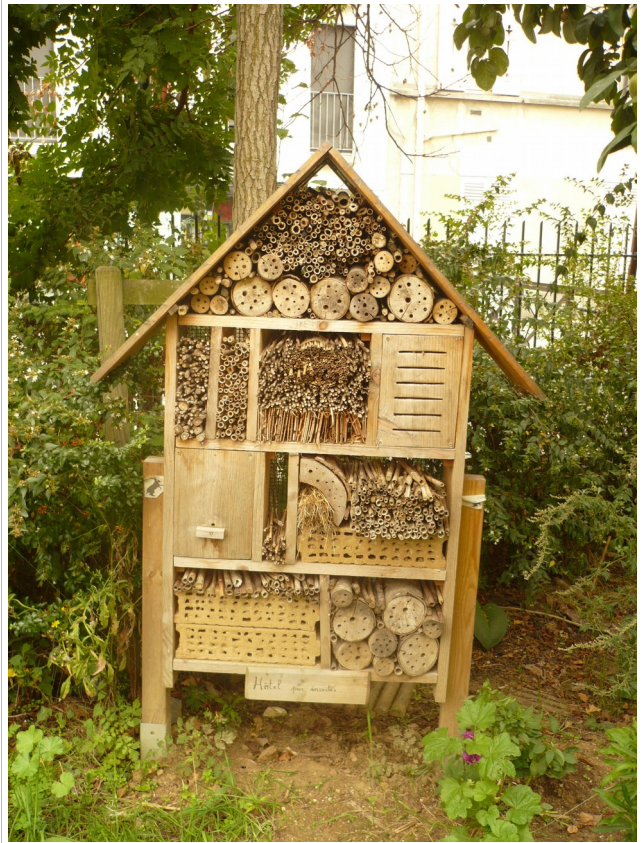
Hôtel à insectes du Lapin ouvrier, Paris 14