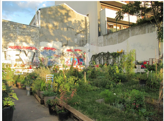
Le jardin Nomade, Paris 11e, septembre 2010