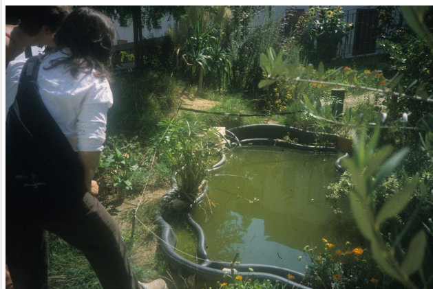
Mare, Papilles et papillons, Paris 20e