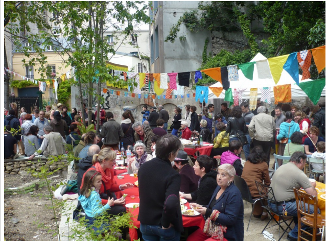
Fête d'inauguration du Jardin des Thermopyles, Paris 14e, juin 2014