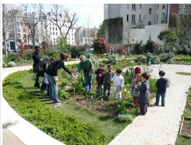
Une classe d'école maternelle au Poireau Agile, square Villemin, Paris 10e