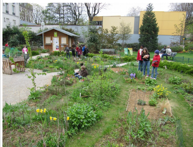
Une classe d'école primaire au Poireau Agile, square Villemin, Paris 10e