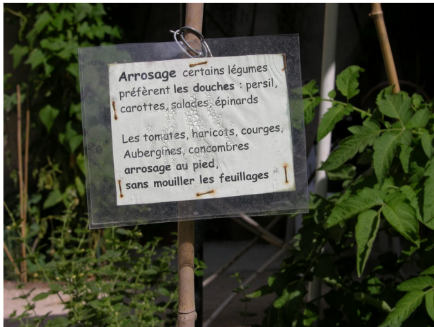
Consignes d'arrosage au Potager des oiseaux, Paris 3e