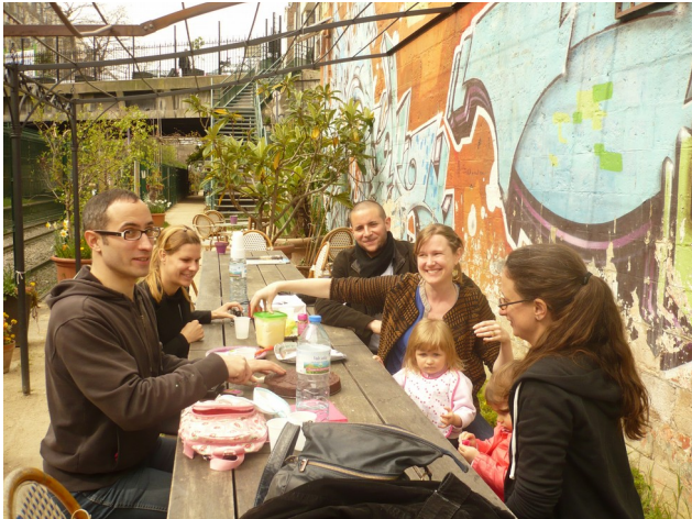
Goûter d'anniversaire aux Jardins du Ruisseau, Paris 18e