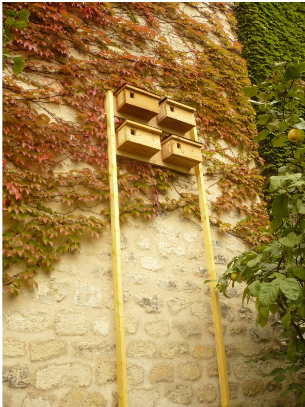
Nichoires, Lapin ouvrier, Paris 14e