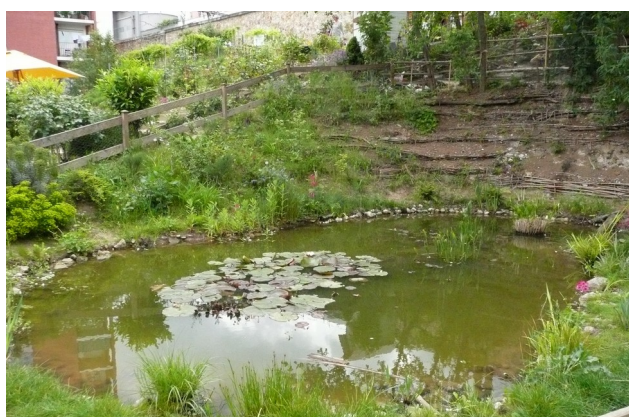
Mare, jardin de L'Aqueduc, Paris 14e