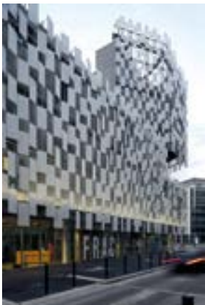
[28] Frac Provence-Alpes-Côte d'Azur