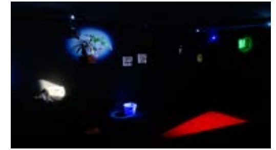
[11] Laure Prouvost, After After , 2013 Collection Frac Bourgogne