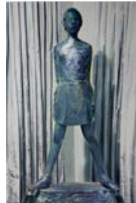
[18] Nina Childress, Statue de Manzu , 2012 Collection Frac Languedoc-Roussillon Photo: Philippe Chancel © Nina Childress