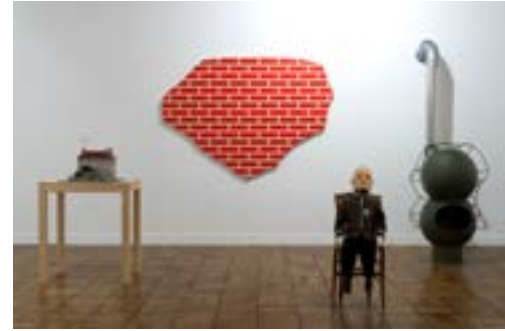
[22] Exposition MORTEL suite et fin , 2015 Commissaire: Mathieu Mercier Au Frac Normandie Caen