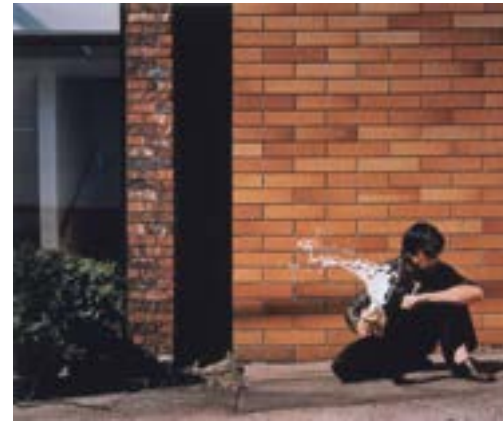
[14] Jeff Wall, Milk , 1984 © Jeff Wall Collection Frac Champagne-Ardenne