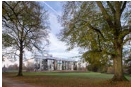
[17] frac île-de-france , le château, rentilly Photo: Martin Argyroglo © Bona-Lemerrier / Alexis Bertrand / Xavier Veilhan Adagp, Paris, 2016