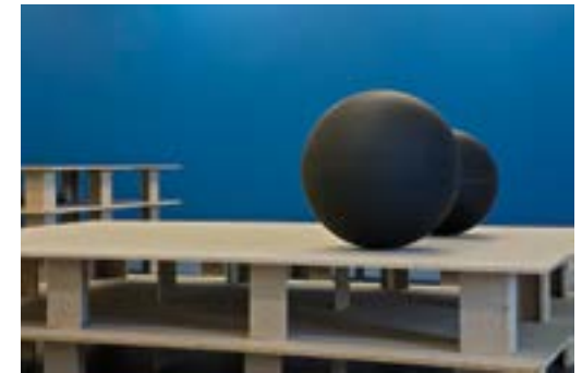
[27] Paolo Codeluppi, Globe muet , 2013 Collection Frac Poitou-Charentes