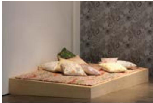
[09] Marc Camille Chaimowicz, A partial Vocabulary , 1984–2008 Collection Frac Aquitaine