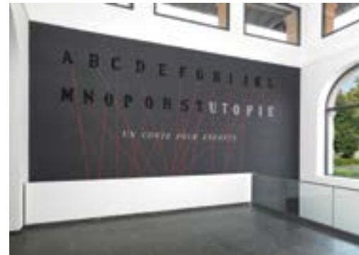
[26] Jean-Michel Alberola, Abécédaire augmenté (partie supérieure), 2013 Exposition Les Pléiades , présentée aux Abattoirs de Toulouse – Frac Midi-Pyrénées en 2013 © Adagp