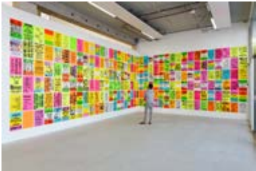
[24] Vue de l'exposition «Dis-moi voir», 2016, Frac Nord-Pas de Calais Dunkerque Collection du Frac Nord-Pas de Calais