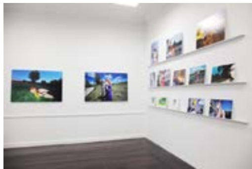
[29] K+P le manifeste couleur à la Maison Bédier, salle Steve Hiatt au Frac Réunion