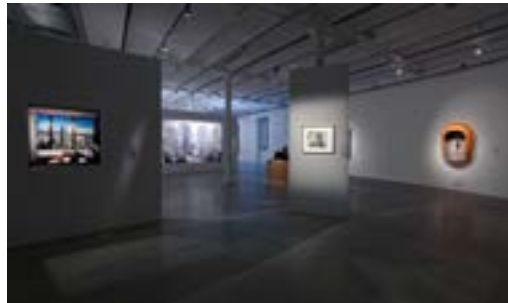
[13] Exposition La ville au loin au Frac centre-Val de Loire , 2016