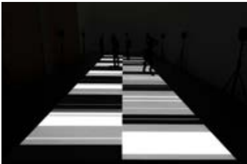
[16] Ryoji Ikeda, test pattern [n°4] , 2013 Collection Frac Franche-Comté © Ryoji Ikeda.