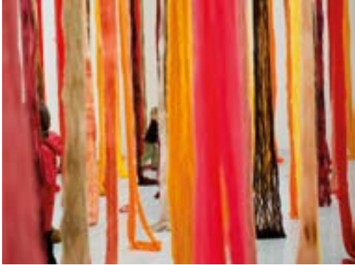
[20] Cecilia Vicuña, Quipu Austral , 2012 / 2013 Collection 49 Nord 6 Est – Frac Lorraine Vue de l'exposition Les Immémoriales , Frac Lorraine © Cecilia Vicuña