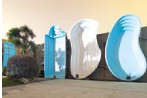
[21] Yohann Gozard, Sans titre de la série: Wonderpools , 2012 Frac Midi-Pyrénées, les Abattoirs