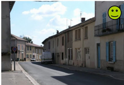
Implantation d'un centre ancien (Saint Nizier Le Désert)

Cette photo illustre le résultat d'une adaptation réussie : alignement des constructions en limite de voie structurant ainsi l'espace de la rue (Treffort-Cuisiat).