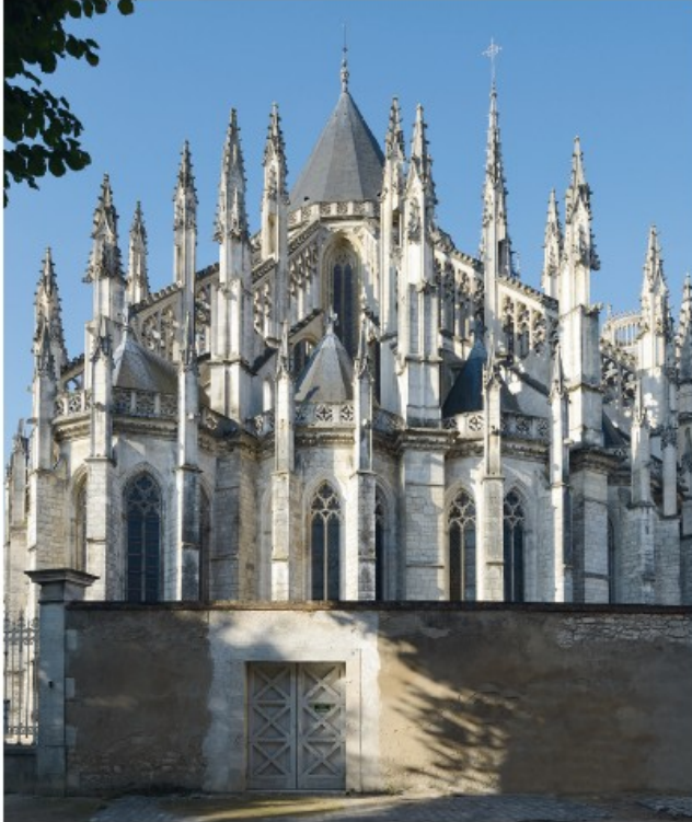
Chevet et chapelles rayonnantes