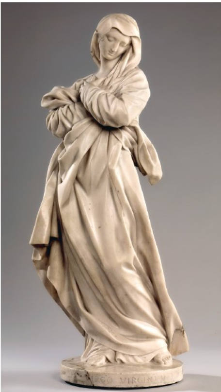
Simon Challe, Vierge de l'Immaculée Conception (Paris, musée du Louvre)