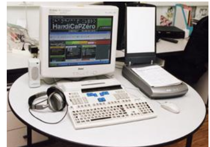
Ordinateur adapté avec lecteur d'écran, agrandisseur de texte, scanner avec reconnaissance de caractères, tablette, braille, machine à lire ...