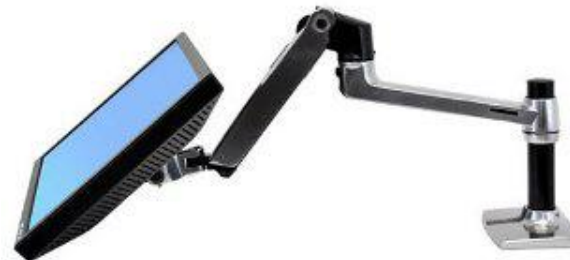
Tablette et bras articulé