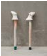
Maude Maris Sans titre vert, sans titre noir 2015