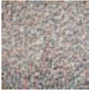
Vera Molnar A la recherche de Paul Klee 1970

Collection Frac Bretagne © ADAGP, Paris