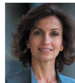
Audrey Azoulay ministre de la Culture et de la Communication

L'éducation artistique et culturelle n'est pas un domaine réservé. Ce n'est pas un luxe pour quelques privilégiés : c'est un bien commun, qui a vocation à être largement partagé. C'est une part essentielle dans l'apprentissage de l'autonomie d'un enfant, d'un adolescent, un élément clef dans sa formation en tant que personne et comme citoyen. Oui, l'éducation artistique et culturelle fait fond sur notre humanité, comme le rappelle Georges Steiner, lorsqu'il écrit que nous sommes, « un animal dont le souffle de vie est celui des rêves parlés, peints, sculptés et chantés » 1 . Cette conviction ne cesse de nous habiter et de nous porter au quotidien, et elle se traduit concrètement par la politique conjointe mise en œuvre par nos deux ministères en faveur de l'éducation artistique et culturelle.