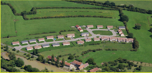
Une urbanisation sans rapport avec son contexte.