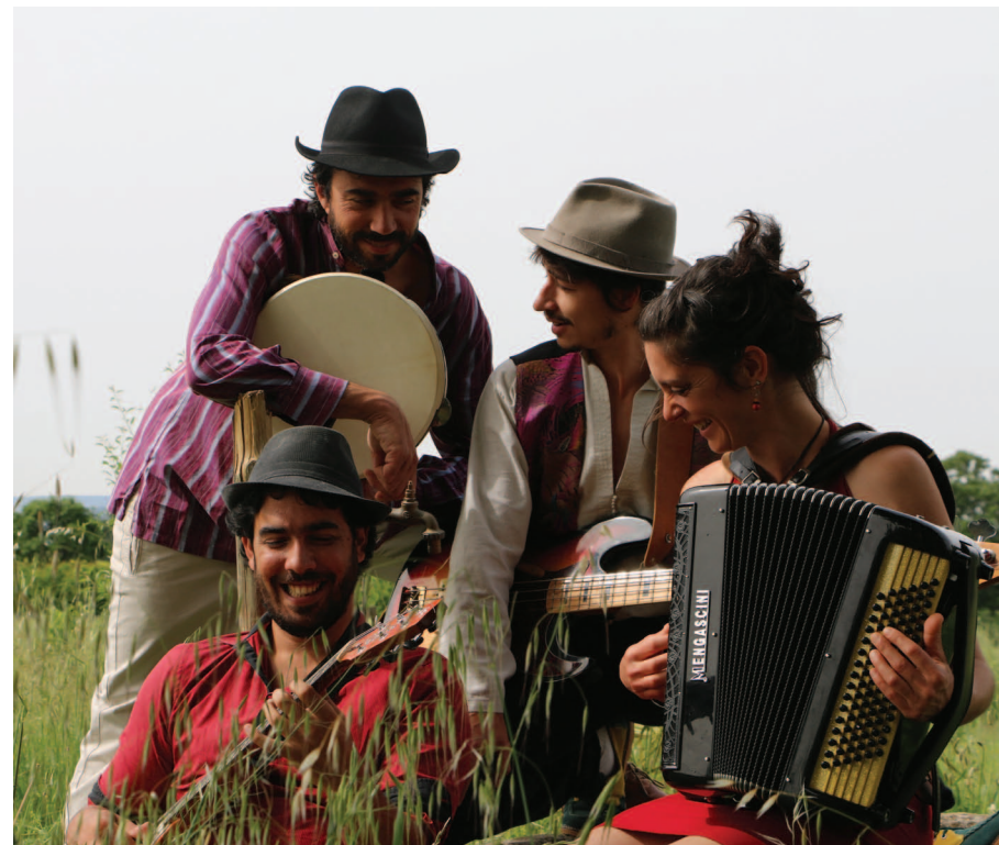
© Conseil départemental de Vaucluse - Collection Musée du Cartonnage et de l'Imprimerie de Valréas

http://www.vaucluse.fr/1087-musee-du-cartonnage-et-de-l-imprimerie-de-valreas.htm