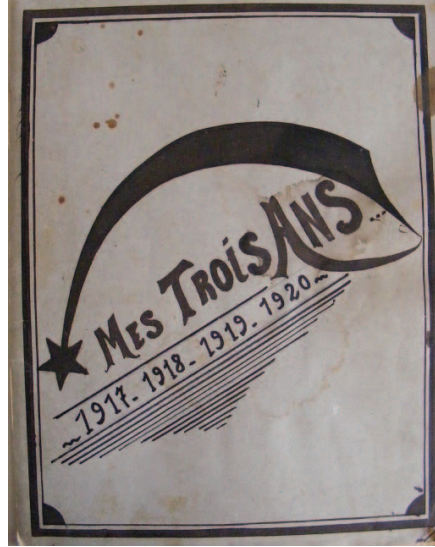
© Archives Communales du Plan de la Tour, don numérique de Claude et Michel PIOVANT, cote 921.

Tél. : 04 94 55 07 55 mairie@plandelatour.net / archives@plandelatour.net