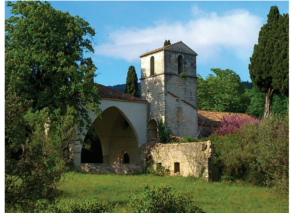
Chapelle Notre-Dame de l'Ormeau

Tél. : 04 94 77 60 39 museefaiencesvarages@wanadoo.fr www.musee-faience-varages.fr