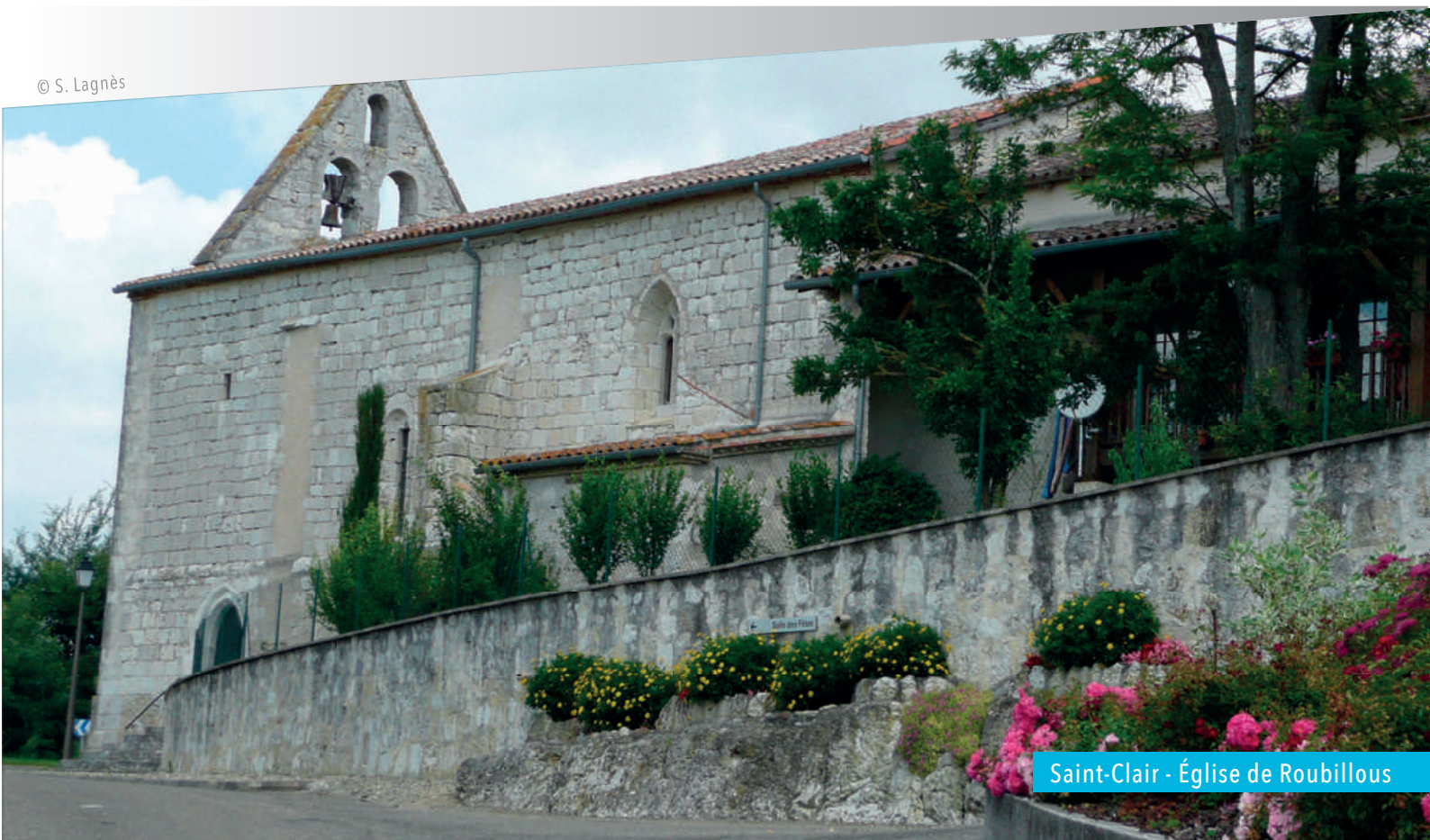
Saint-Clair - Église de Roubillous