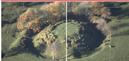
Motte de Fressenneville (Somme)