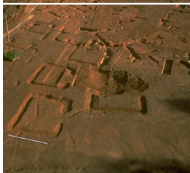
Bibracte, vue de la nécropole de la Croix du Rebut, Tène finale-époque augustéenne, 1998