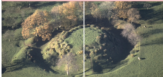
Motte de Fressenneville (Somme)