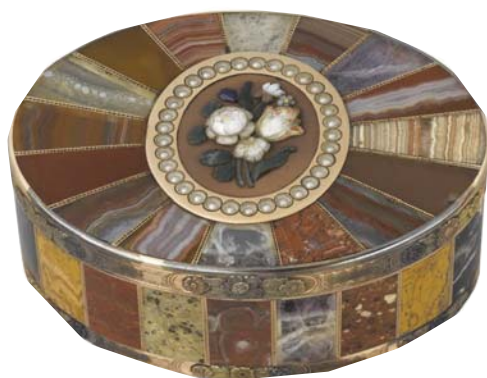
Deux tabatières de Johann Christian Neuber, département des Objets d'art, musée du Louvre

Neuber était aussi le conservateur des collections de la Voûte verte de Dresde et l'un des meilleurs minéralogistes de son temps.