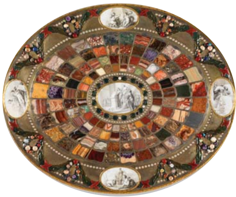
Table de Teschen , 1779, Johann Christian Neuber, H 81,5 cm ; L du plateau 70,5 cm, bronze doré, pierres dures, porcelaine de Saxe sur âme de bois, signée sur le plateau Ci-dessous à droite : la Table de Teschen et son livret Ci-dessus : vue du plateau

Elle s'inscrit de façon magistrale dans la tradition séculaire des meubles d'orfèvrerie réalisés à la gloire des souverains d'Europe.