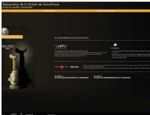
La cour Napoléon et la pyramide © Musée du Louvre/C. Abad. Site officiel de la campagne de don Victoire de Samothrace