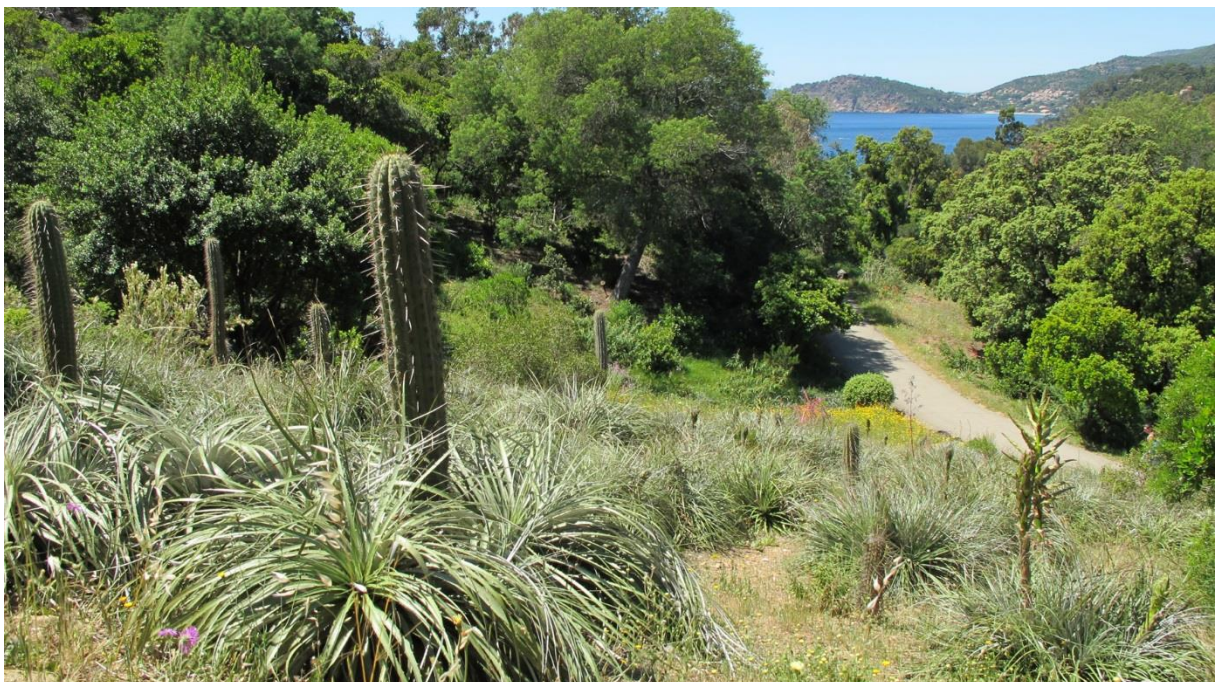
Jardin du Chili

Dans un site exceptionnel, ce domaine privé de la corniche des Maures était menacé de spéculation et de disparition dans les années 1970. Sauvé en 1989 par le Conservatoire de l'espace littoral et des rivages lacustres, il a été totalement redessiné depuis cette date par le paysagiste Gilles Clément. Sur une superficie de 20 hectares, dont 7 aménagés en jardins paysagers d'ambiance, le propos est de réaliser un index planétaire ouvert sur les régions biologiquement comparables, d'évoquer le paysage et la flore de ces régions méditerranéennes du monde. La promenade permet de passer du jardin californien au jardin australien, du jardin sud-africain au jardin chilien ... Au coeur du jardin, la pergola et le grand degré évoquent l'ancien domaine.