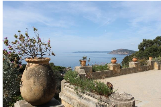
Vue depuis l'esplanade de l'hôtel de la mer

Dans un site exceptionnel, ce domaine privé de la corniche des Maures était menacé de spéculation et de disparition dans les années 1970. Sauvé en 1989 par le Conservatoire de l'espace littoral et des rivages lacustres, il a été totalement redessiné depuis cette date par le paysagiste Gilles Clément. Sur une superficie de 20 hectares, dont 7 aménagés en jardins paysagers d'ambiance, le propos est de réaliser un index planétaire ouvert sur les régions biologiquement comparables, d'évoquer le paysage et la flore de ces régions méditerranéennes du monde. La promenade permet de passer du jardin californien au jardin australien, du jardin sud-africain au jardin chilien ... Au coeur du jardin, la pergola et le grand degré évoquent l'ancien domaine.