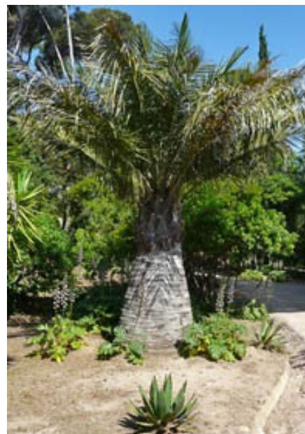
© Brigitte Larroumec, drac paca crmh, 2009

Entre la ville et la mer, dans le quartier de Costebelle, la propriété du Plantier bénéficie depuis ses trois belvédères d'une large vue sur les salins de Hyères. Elle conserve un environnement naturel où les tortues d'Hermann ont trouvé refuge.