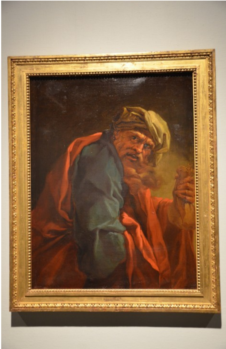
Seconde moitié du XVIIIème siècle