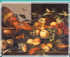
③ Nature morte au chaudron , école hollandaise attribuée à Joris Van Son, XVII e siècle, huile sur bois

Une classe de 4 e du lycée agricole du Subdray restitue le tableau étudié sous forme d'un grand puzzle.