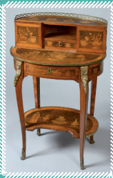
① Bonheur du jour - Estampille Charles Topino Décor en marqueterie montrant des tasses et thèières

Une classe 1 ère année et une classe 2 e année – Brevet professionnel, spécialité Peinture, du lycée Jean de Berry de Bourges ont décidé de travailler sur deux pièces de l'hôtel Lallemant le thème choisi cette année à l'occasion de la Nuit des Musées étant «A Table !». La première est une table, du milieu du XVI e siècle ; la seconde concerne un petit bureau, appelé aussi bonheur du jour.