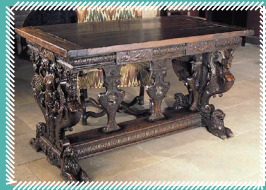
Table, milieu XVI e siècle Menuisier sculpteur anonyme ②

Une classe 1 ère année et une classe 2 e année – Brevet professionnel, spécialité Peinture, du lycée Jean de Berry de Bourges ont décidé de travailler sur deux pièces de l'hôtel Lallemant le thème choisi cette année à l'occasion de la Nuit des Musées étant «A Table !». La première est une table, du milieu du XVI e siècle ; la seconde concerne un petit bureau, appelé aussi bonheur du jour.