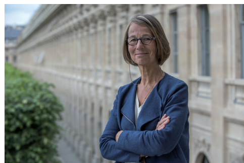
Françoise Nyssen ministre de la Culture

Sans indication de tarif, les animations sont gratuites.