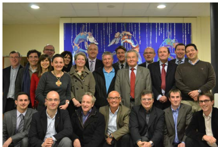
Les mécènes posant devant leur première œuvre réalisée en commun.

La fondation d'entreprises dénommée « Fondation d'Entreprises Mécènes Caen Normandie » a pour objet de « soutenir, par tous moyens matériels, humains, techniques ou financiers, les actions d'intérêt général porteuses d'image pour et sur le territoire de la circonscription de la CCI Caen Normandie, à caractère innovant et/ou original, dans les domaines de la culture et des nouvelles technologies porteuses d'avenir pour le territoire ».